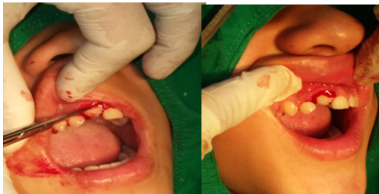
Fig. 3. Eliminación del tejido gingival (Gingivectomía).

El tratamiento consistió inicialmente con la educación para la salud y motivación, indicación de la higiene bucal correcta y controles de placa mecánicos y químicos, utilizando enjuagatorios con clorhexidine al 0,02 % dos veces al día. Posteriormente se pasó a la fase correctiva quirúrgica, procediendo a la eliminación del tejido gingival excesivo, con técnica de gingivectomía, se tomó muestra para biopsia y gingivoplastia para devolver el contorno y biselado normal de la encía, y exponer el diente en la cavidad bucal, luego, se procedió a cubrir la zona con apósito periodontal. El paciente se mantuvo en fase de soporte periodontal durante los dos primeros posoperatorios con consultas y evaluaciones frecuentes (Figura 3).