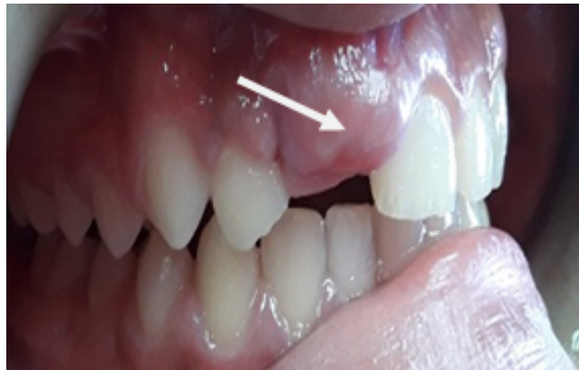
Fig. 1. Aumento de volumen en zona del 11.

Presencia de agrandamiento gingival en zona de incisivo central superior derecho (11), de aspecto fibroso, consistencia firme, color rosa coral con escaso sangrado al sondaje. Cierre bilabial incompetente, labio superior hipotónico e inferior hipertónico, vestíbulo-versión del incisivo lateral superior derecho 12, resalte de 4 mm, relación de molar de neutra oclusión, sobrepase 2/3 de corona valorado como clase I sindrómica de Moyer (Figura 1).