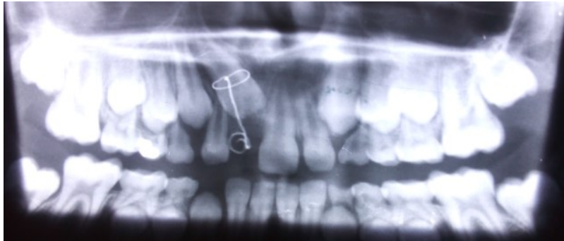
Fig. 2. Radiografía panorámica que muestra diente 11 retenido e inclinado con rotación.

Impresión diagnóstica: hiperplasia gingival fibrosa localizada (agrandamiento gingival localizado).