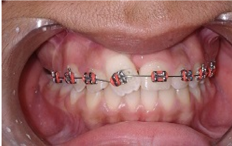
Fig. 4. Dos meses después de la operación.

Se dieron indicaciones a la madre y al paciente sobre los cuidados a tener en cuenta para una buena evolución. Se mantuvo una estrecha vinculación Periodoncia-Ortodoncia durante el tratamiento de este paciente como se muestra en la Figura 4 y se evaluó el posoperatorio cada dos meses por consulta de Periodoncia, donde se apreció buena cicatrización y reparación de la zona intervenida.