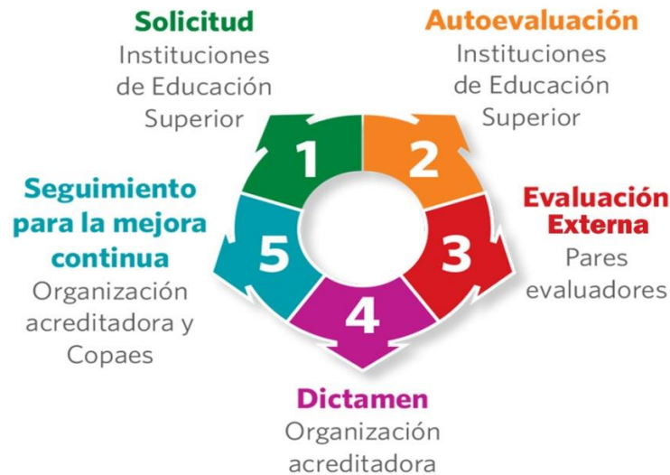
Figura 1. ¿Cómo acredita COPAES? Recuperado de https://www.pnpec.sep.gob.mx/copaes.php