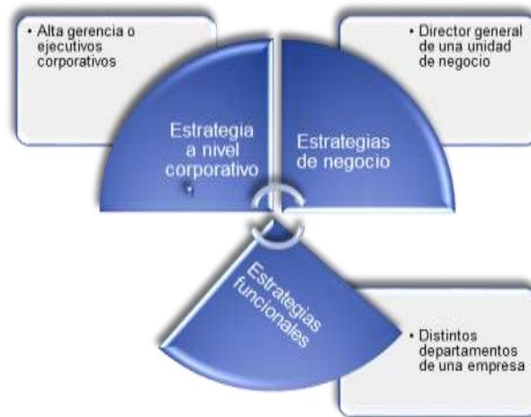
Figura 1. Pirámide de Jerarquías de Estrategias. Fuente: Koontz y Weihrich (2013).