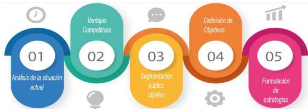
Figura 2. Elementos de la propuesta

En esta propuesta se da a conocer elementos centrales para el desarrollo de la misma, que se detallan a continuación: Diagnóstico en donde constan las fortalezas, oportunidades, debilidades y amenazas del Cantón, se definen ventajas competitivas, segmentación público objetivo, definición de objetivos y como finalización formulación de estrategias, se detalla en la Figura 2: