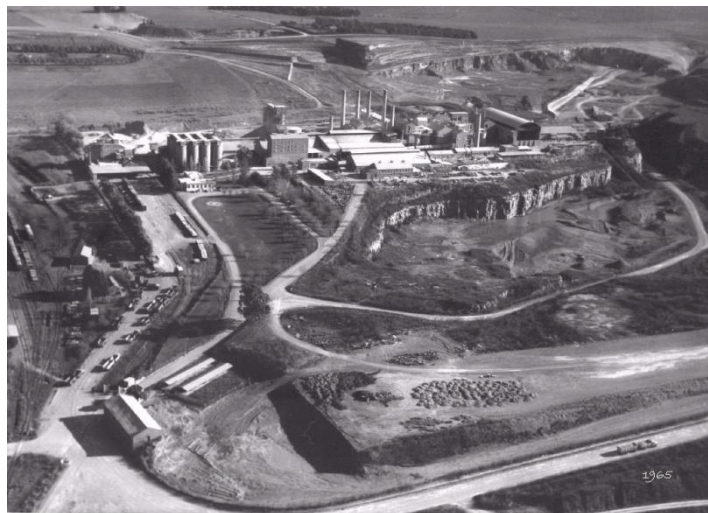
Figura 9. Fotografía aérea de la fábrica San Martín de la Compañía Argentina de Cemento Portland en Sierras Bayas, año 1965.

También se expusieron las primeras bolsas de tela blanca utilizadas para envasar y despachar el cemento Portland y las máquinas de coser utilizadas para su elaboración, así como la impresión del logo de la empresa en color azul. Esas bolsas adquirieron a lo largo de los años un alto valor simbólico en la historia de todos los sierrabayenses. La máquina de coser cumplió un rol muy importante dentro de la empresa, ya que significó la fuente de trabajo de decenas de mujeres, que se encargaban de reparar las bolsas que retornaban a la fábrica. Se exhibieron además las primeras camisetas de fútbol utilizadas para representar al Club Social y Deportivo de Sierras Bayas. El dato anecdótico en relación a la importancia de la actividad industrial cementera en el pueblo es que los colores que representaban al club (amarillo y negro) fueron tomados del logo de la empresa.