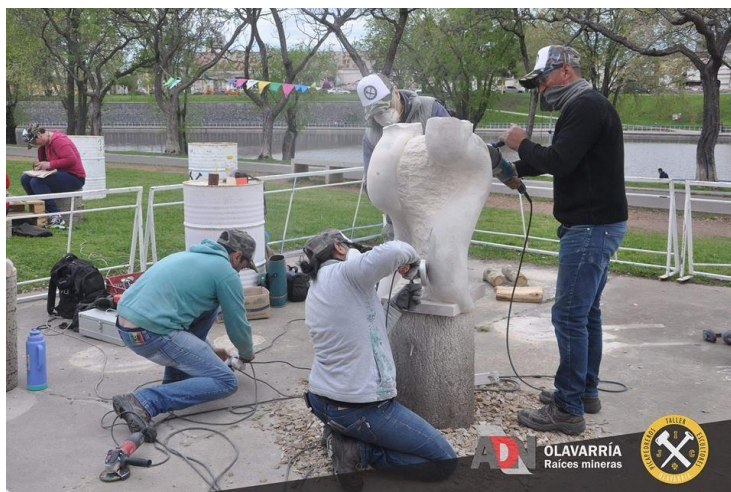
Figura 4. Escultura del eslabón de la cadena de ADN realizado en vivo por integrantes del Taller de Picapedreros y Escultores.

escultores) (Figura 4), eventos musicales y ferias gastronómicas. Según datos públicos, alrededor de 1.500 personas asistieron a la exhibición en el transcurso de la semana que tuvo de duración 5 .