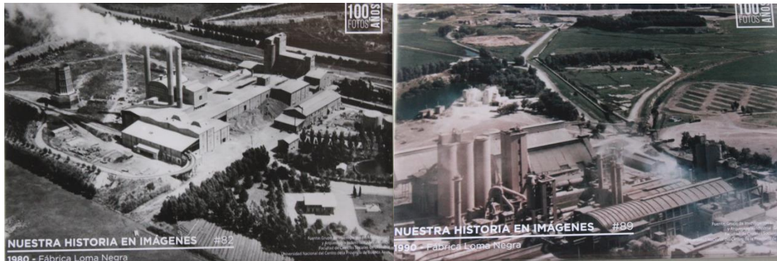
Figura 6. Imágenes de la muestra “Historia del Cemento Portland en Argentina”, expuestas en el CCO.

Laboratorios” (1955); a “Alfredo Fortabat con gente del pueblo” (1956) y al “Edificio de la Escuela de Sierras Bayas” (1958). De los años ‘60 no se presentan fotografías y de los años ‘70 se exponen las “Casas de empleados y capataces”; la “Vista Aérea de Fábrica” (1971) y también la “Calle principal de Hormigón” (1973) y la “Construcción de Silos” (1978). Entre las últimas imágenes se incluyeron dos fotografías de la “Fábrica Loma Negra”, una de 1980 y otra de 1990 (Figura 6).