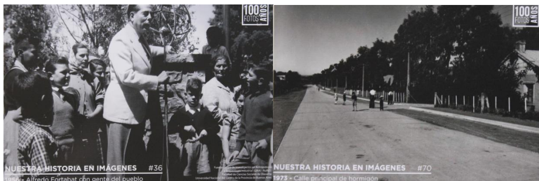
Figura 7. Imágenes de la muestra “Historia del Cemento Portland en Argentina”, expuestas en el CCO.

De esta exposición se destaca un anclaje puesto en lo visual, ya que la muestra no contiene texto, así como en la fotografía como fuente documental de una historia local ligada a la industria del cemento, donde prima el registro sobre la fábrica y/u otros edificios asociados con esta, como sus oficinas y laboratorios. Sin embargo, la vida alrededor de este modelo de producción, se observa solo a través de imágenes de las viviendas de empleados y capataces y de la escuela del barrio, aunque en ellas se prescinde de la población. La participación de los vecinos se observa sólo en dos oportunidades: una como anexo del concepto central de la fotografía que versa sobre las calles de hormigón, donde pueden verse niños en el fondo; y otra, donde el protagonista de la imagen es Alfredo Fortabat emitiendo un discurso sobre un escenario rodeado de vecinos del pueblo (Figura 7). Esta imagen demuestra una presencia sobresaliente de este personaje por sobre otros, que se rescata como la única figura omnipresente de la historia cementera local.