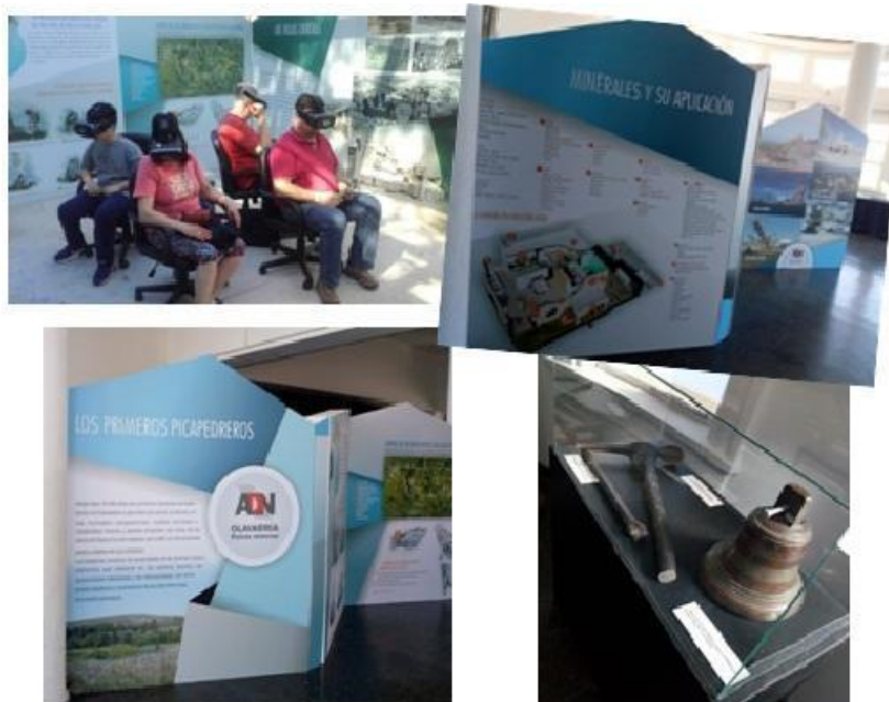
Figura 3: Imágenes representativas de la exposición ADN.

La muestra se completó con la exhibición de actividades artesanales en vivo (realización de modelado en arcilla y talla de piedra del taller de picapedreros y