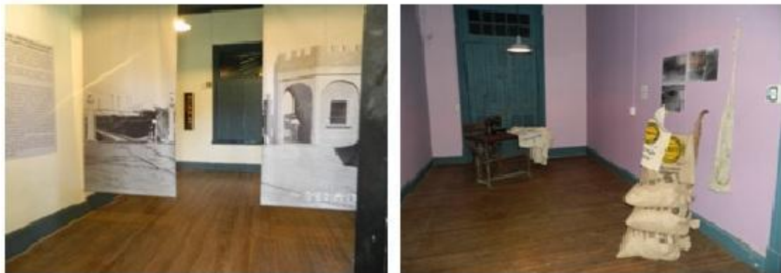
Figura 8. Izquierda Sala 1(ingreso a la Exhibición). Derecha Sala 2 (“la embolsadora”), Museo de la Estación de Sierras Bayas.

En el museo, cada uno de los espacios fueron utilizados para representar - con fotografías, imágenes y planos- la historia de la industria de cal y cemento en Sierras Bayas y los actores que fueron parte de este proceso desde sus inicios hasta la actualidad (Figura 8). Presentadas en un orden cronológico con sus respectivas informaciones, las diversas gigantografías ilustraron las etapas por las que fue transitando la empresa cementera (Figura 9). Cabe destacar que al ingresar por la puerta principal del Museo se encontraba la máquina original utilizada por los trabajadores del cemento para “marcar tarjeta” al inicio y finalización de su jornada laboral y que también servía como control del pago mensual y quincenal. Esto representó un gran atractivo para los estudiantes, quienes tuvieron la oportunidad de marcar una tarjeta tal como lo hacían sus antepasados, los obreros de fábrica.