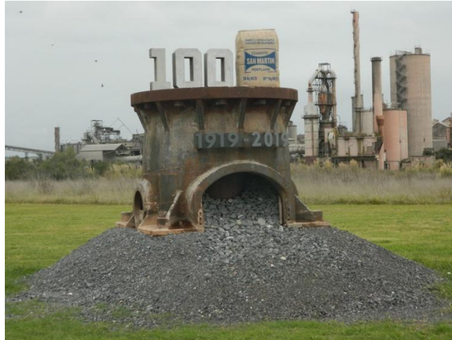
Figura 10. Monumento inaugurado en febrero de 2019 al conmemorarse los 100 años del primer despacho de cemento Portland.