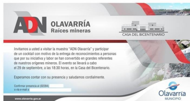
Figura 2. Tarjeta de invitación a la inauguración de la exhibición ADN.

escolares programadas 4 , el día 29 se realizó la inauguración oficial y en dicho marco se efectuó además un reconocimiento a actores vinculados al sector minero (Figura 2). Finalmente, durante la jornada del domingo 30 se abrió la exhibición al público en general, con la utilización de diversos recursos expositivos, incluyendo paneles infográficos, realidad virtual y exposición de piezas originales cedidas en préstamo por el Museo Municipal de la Piedra “Emma Occhi” de la localidad de Sierra Chica (principalmente herramientas de hierro empleados para la extracción manual de la piedra y su posterior procesamiento) (Figura 3).