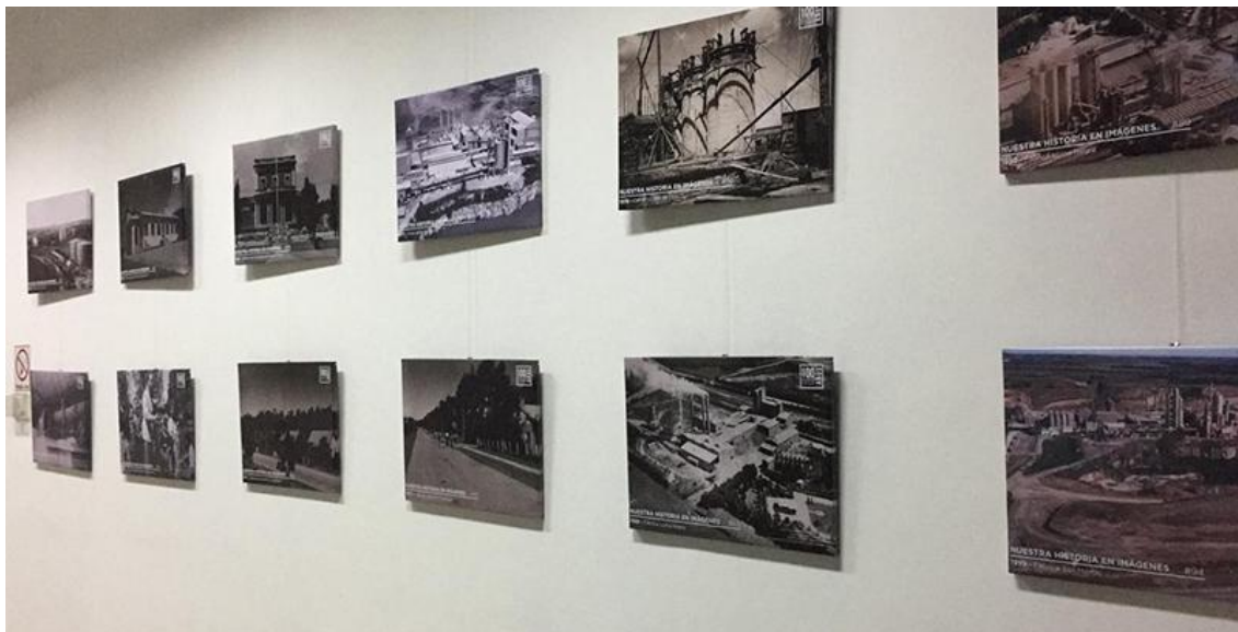
Figura 5. Imágenes de la muestra “Historia del Cemento Portland en Argentina”, expuestas en el CCO.

La muestra se centró en 12 imágenes en total (Figura 5) que cuentan cronológicamente la historia de la producción cementera local, desde la década de 1940 -con una primera fotografía que muestra desde arriba la “Fábrica de Loma Negra”- hasta una última imagen del año 1999, en donde se puede observar la “Fabrica San Martín” de Sierras Bayas, también desde una toma aérea.