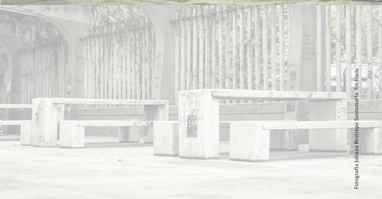
Fotografía Juliana Restrepo Santamaría. Sin título