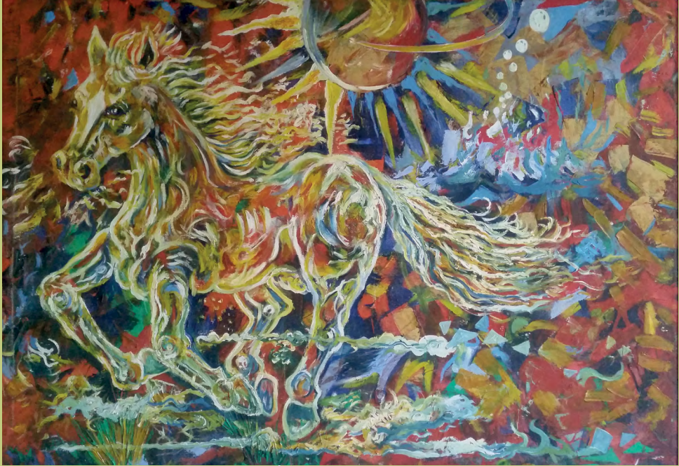
Autor: Marlon Alexis Monsalve Arias Título: Fuerza sobre el caos Técnica: óleo sobre lienzo Año: 2004