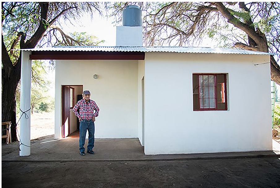
Figura 4. Vivienda del PSVPEMC