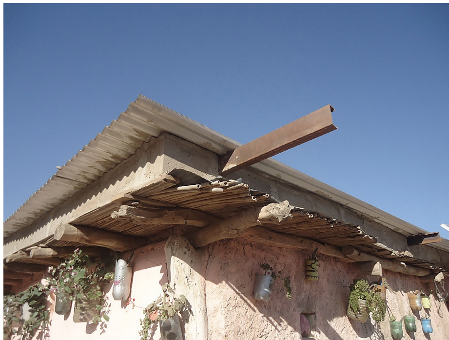
Figura 3. Mixturas en detalles constructivos

Detalle constructivo en el que se puede observar la diversidad de materiales que dan forma a la arquitectura vernácula: adobes, horcones, enramada, carga de tierra, bloque cementicio, hierro y chapa, entre otros.