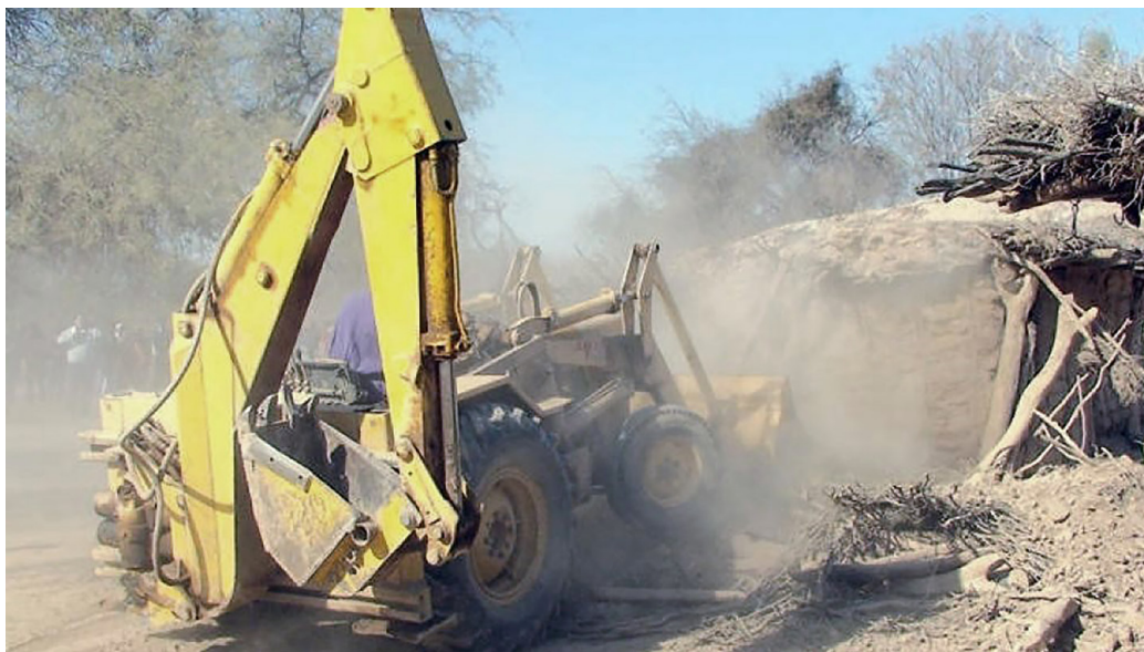
Figura 2. Demolición de una vivienda-rancho

Fuente: diario Día a Día (31 de julio de 2009).