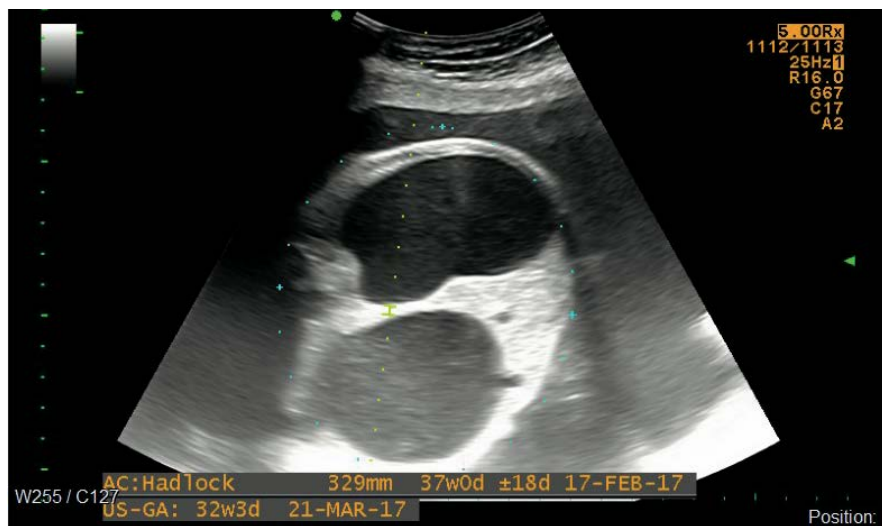
Figura 4. Embarazo de 31,5 semanas, signo de doble burbuja intraabdominal, corte transversal abdominal.