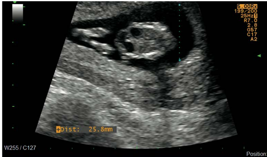
Figura 1. Embarazo de 12,1 semanas, signo de doble burbuja intraabdominal, compatible con atresia duodenal.

se realizó inicio del estímulo enteral trófico por gastrostomía. En segundo tiempo quirúrgico, 34 días después, se realizó toracotomía derecha y anastomosis término terminal esofágica.