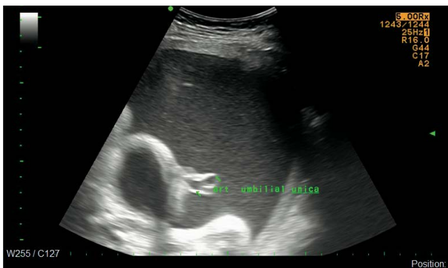
Figura 2. Embarazo de 31,5 semanas, arteria umbilical única.