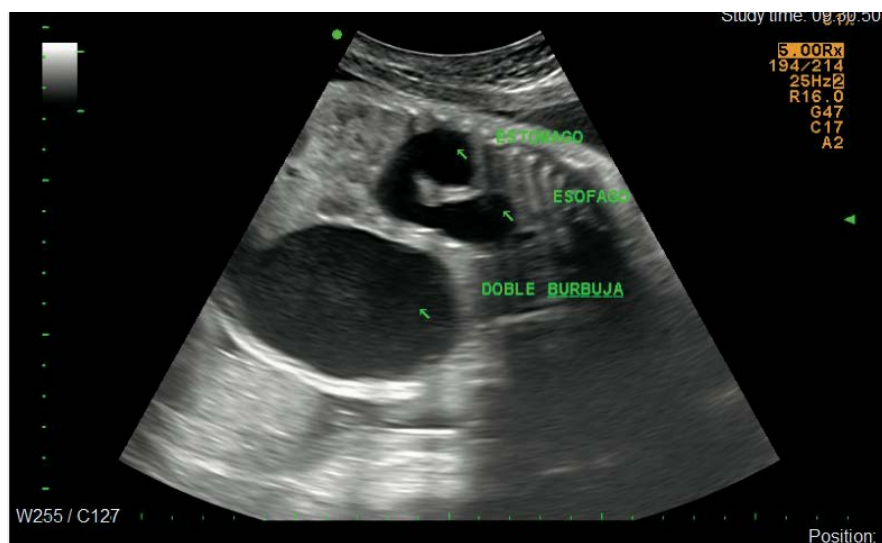
Figura 3. Embarazo de 31,5 semanas, signo de doble burbuja intraabdominal, dilatación esofágica en el tercio distal; corte longitudinal.