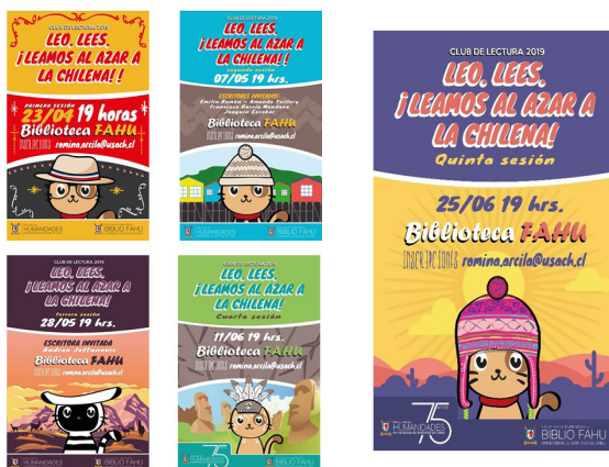
Imagen 4. Afiches segundo ciclo Club de lectura: Leo. Lees. ¡Leamos al Azar a la chilena!

Diseño de afiches: diseñadora gráfica Daniela Picarte.