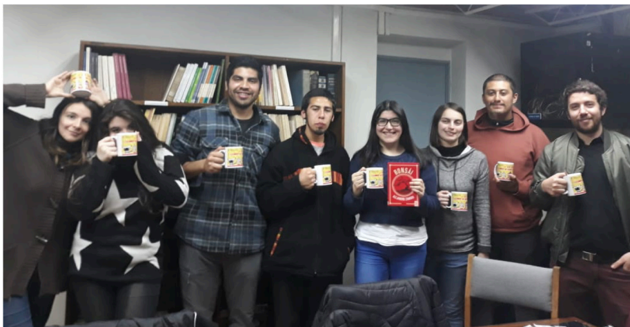
Imagen 5. Segundo ciclo Club de Lectura: Leo. Lees. ¡Leamos al Azar a la Chilena!

En cuanto a los resultados de este primer ciclo 2019, se puede decir que se leyeron y comentaron en total siete textos en cinco sesiones, con autores como: Pedro Lemebel, Roberto Bolaño y Alejandro Zambra.