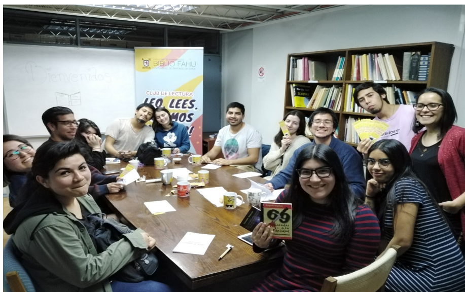
Imagen 7. Tercer ciclo Club de Lectura: Leo. Lees. ¡Leamos al Azar Latinoamérica!