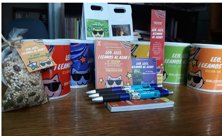
Imagen 2. Recuerdos Club de Lectura FAHU 2018

Esta figura del gato también se añadió a unos recuerdos (marcapáginas, lápices, libretas, etc.) que se comenzaron a regalar a los/as participantes en cada sesión del club de lectura, lo que sin planificarlo concedió gran identidad al grupo, llegando a considerarse verdaderos tesoros, como lo comentó una asistente al club de lectura.