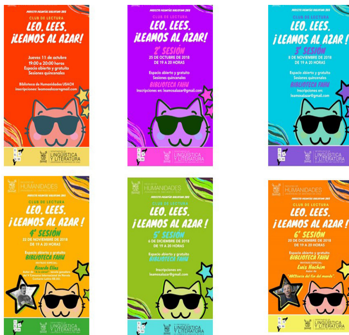
Imagen 1. Afiches primer ciclo Club de lectura: Leo. Lees. ¡Leamos al azar!

Diseño de afiches: diseñadora gráfica Daniela Picarte.