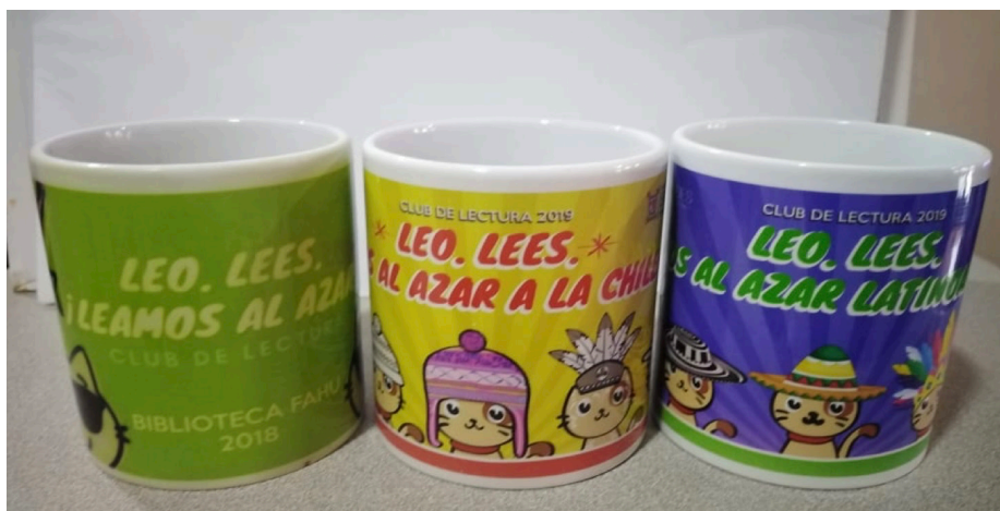
Imagen 8. Tazones regalos Club de Lectura FAHU 2018-2019