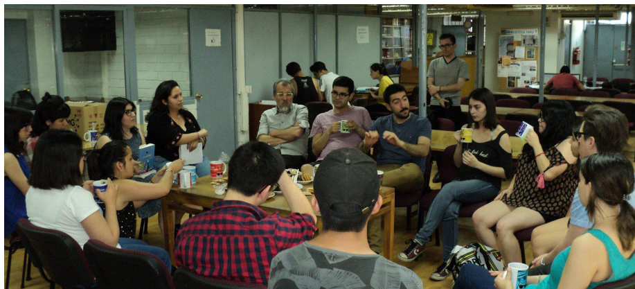
Imagen 3. Fotografía cuarta sesión Club de Lectura. Leo. Lees. ¡Leamos al azar!