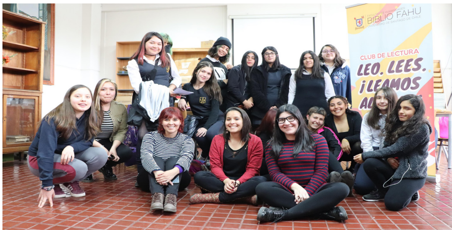
Imagen 9. Club de Lectura: Leo. Lees. ¡Leamos... Nuevas narrativas!