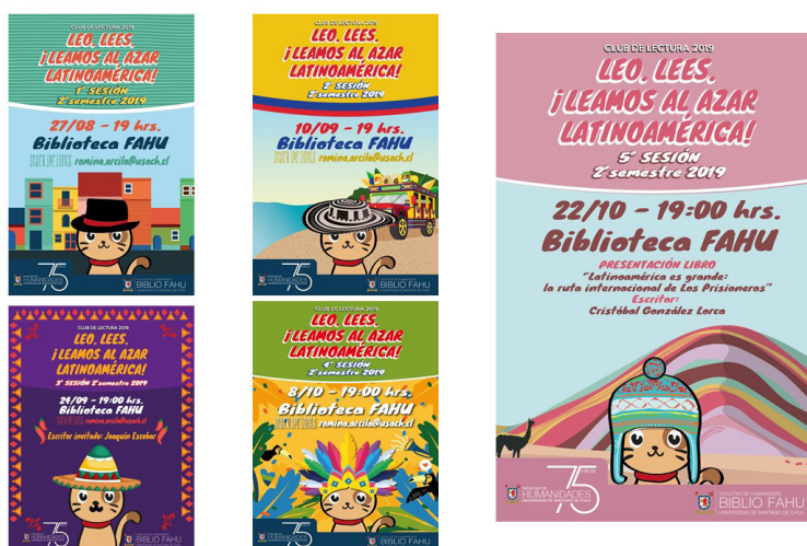
Imagen 6. Afiches tercer ciclo Club de Lectura: Leo. Lees. ¡Leamos al azar Latinoamérica!