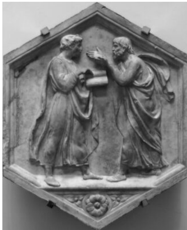
Foto: Della Robbia, Plató ensenyant a Aristòtil , Wikimedia commons cc by 2.5.

tecnologia, amb la seva atractiva eficàcia instrumental, absorbeix sovint de forma babaua l'atenció i l'interès de moltes persones i tendeix a la difuminació, o fins i tot a l'eliminació, d'objectius finalistes de plenitud de la pròpia existència. Deia Einstein ja fa molts anys que «vivim una curiosa època, la dels instruments més perfectes de la història al servei dels objectius més confusos»; la massificació, avui revestida de modernitat amb el nom de globalització, per una banda accentua l'individualisme competitiu —«tots contra tots»— i per altra banda dissol les diferències individuals i culturals en un magma uniformitzador —com a petit exemple, la invasió de molts països amb el Halloween nord-americà—. I les manipulacions mediàtiques, fetes amb eines cada vegada més poderoses i cada vegada més concentrades en poques mans, ens estan instal·lant en allò tan lamentable, ja esmentat, de la «postveritat», que pretén justificar el predomini de les emocions manipulades grollerament per ells com a «criteri de realitat» per damunt dels fets i la deliberació crítica sobre ells, i amb això destrossen alhora la plenitud i l'autonomia de les persones, que no són possibles ni pensables al marge d'una mínima recerca i confiança en la veritat o, com a mínim, en la veracitat que volen aportar molts bons professionals dels mitjans informatius.