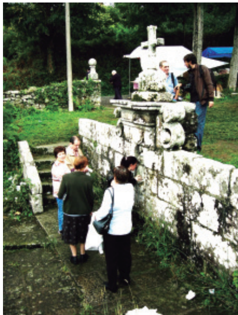
Unha devota petando coa cabeza contra a imaxe da Virxe.

e) Levar auga para a casa, para uso propio ou dalgún familiar ou veciño que non pode asistir.