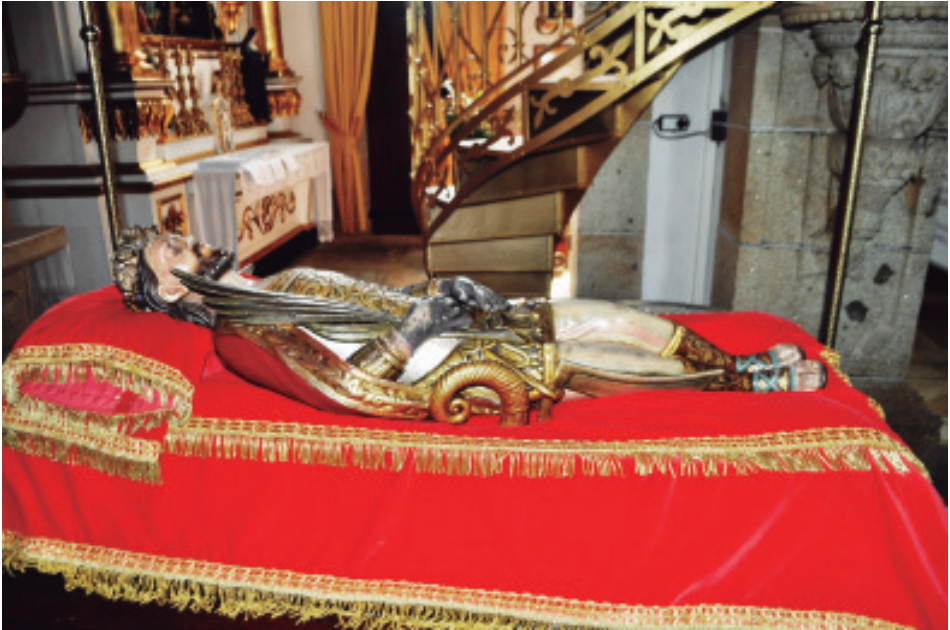
Imaxe de san Campio de Figueiró, disposta para saír na procesión.

l) Como noutras partes, aínda se conserva a tradición de poxar os banzos ou banceiros das andas do santo ao remate da procesión, para metelo na igrexa quen máis ofreza.