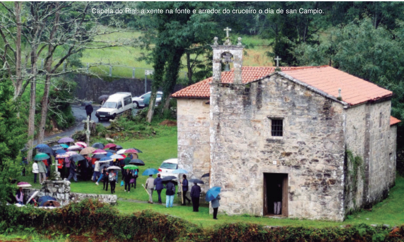
Capela do Rial: a xente na fonte e arredor do cruceiro o día de san Campio.

O cambio de mentalidade e a mellora das comunicacións acabaron coa presenza dos devotos que se ofrecían ir a pé dende lonxe ao santuario.