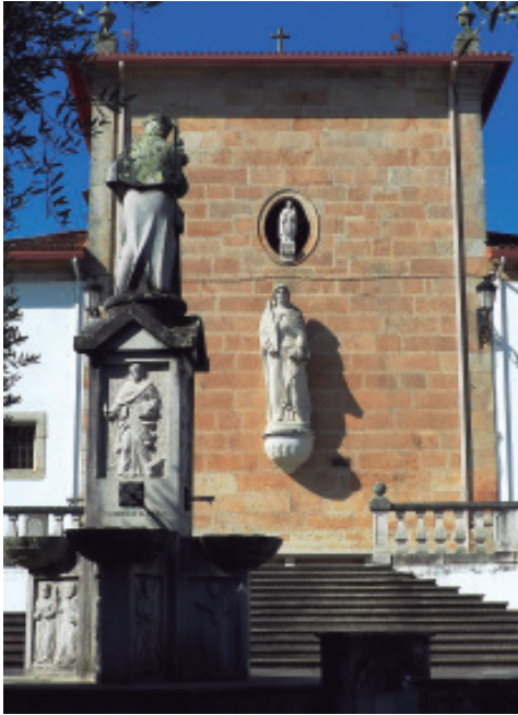
Imaxe de santa Arquelaida no testeiro do presbiterio da igrexa de Figueiró, obra do escultor J. Antúñez Pousa, 2002.

19 de xaneiro do ano 293. En Figueiró convertérona na «protectora da familia» e está representada cunha palma na man dereita, atributo do martirio, e un libro na esquerda. No templo hai varios carteis coa seguinte oración, así como nas estampas: