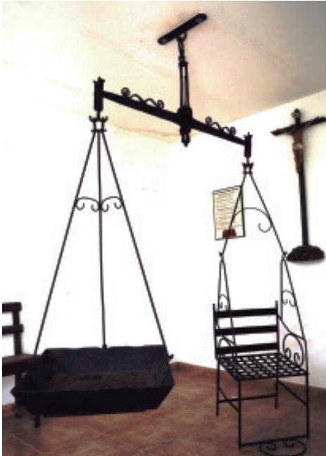
A actual balanza data de 1996 (capela da pesa).