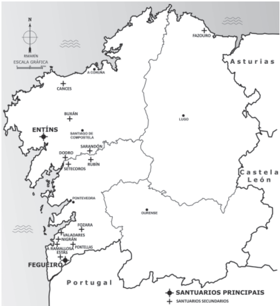
Santuarios de san Campio en Galicia (debuxo de X. R. Marín).

yor] decenzia, y mucha yluminaon. la Capilla de aquella Cassa, con concurrencia de muchos Sres. Abades, y ppnas. [personas] particulares de la circunferencia, quienes con el ynmenso Pueblo que seguia al Sto. Cuerpo, oyeron una Misa cantada (1795. San Ouren-te..., 1795: s. f. -30r / 30v-).