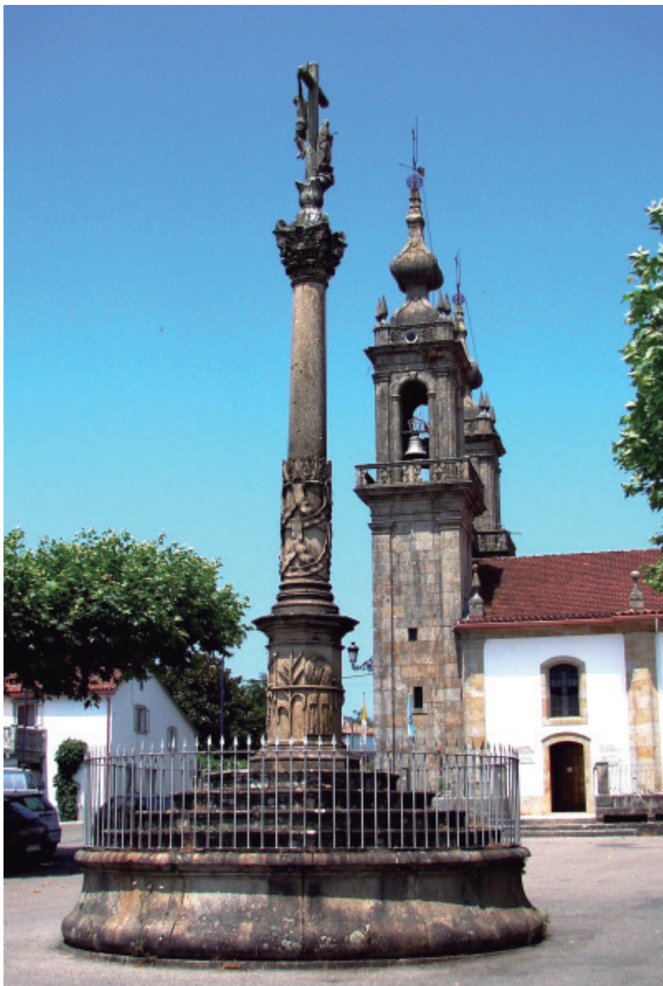
Igrexa e cruceiro de Figueiró.