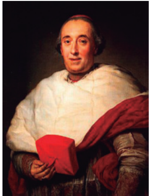
O cardeal Francesco Saverio (Francisco Javier) de Zelada Rodríguez, por A. Raphael Mengs, c. 1773 ( Museo Cívico , Pistoia, Italia).

As obras comezaron o 22 de marzo de 1784 e non rematarían ata dez anos despois, agás a cúpula que aínda foi en 1801 (o ano do pasamento do cardeal). Segundo consta nas catro