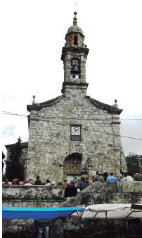
Igrexa parroquial de santo Ourente de Entíns un 29 de setembro, día grande da festa de san Campio.

pendentes da mesma, correu cos custos, pero cómpre entender que non é que el puxese os cartos, senón que foi á conta das pingües rendas que lle correspondía recibir polo cargo que ostentaba (García, 1918: XXXV-373):