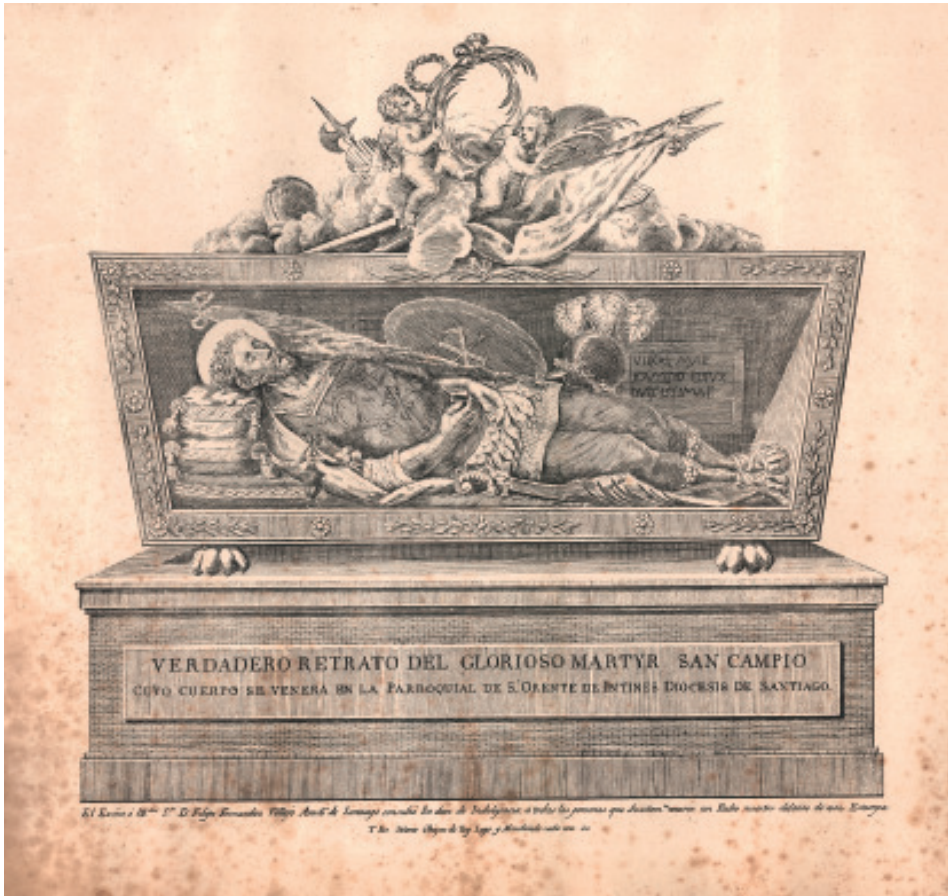
San Campio na urna do escultor Ferreiro: gravado calcográfico de Melchor de Prado Mariño (Museo do Pobo Galego).

brillar, polo que significa «o que resplandece de alegría» ou «o iluminado pola felicidade». Dito isto bota man da haxiografía de Caralampio, do que afirma que é posible que fose perseguido polos xudeus e que o matasen, pero, «de todos modos, la historia nos lleva, mejor que a Antioquía, a la hora del martirio, a Roma, pues en la Ciudad Eterna, precisamente en el cementerio romano de San Calixto, fue donde se encontró la sepultura con los restos del Santo».