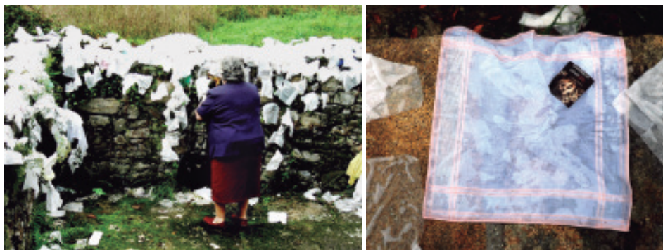
Unha muller deixando o pano con que se enxugou e un dos que venden na capela cun adhesivo do santo.

b) O día da festa os fieis asisten a unha misa, deixan as ofrendas, agora só exvotos de cera (cabezas, corpos enteiros, pernas, mans...), candeas da súa altura ou pequenas e esmolas.