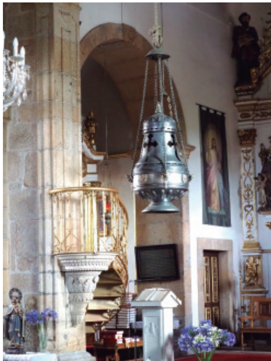
Igrexa de Figueiró: un dos botafumeiros.

diante do baldaquino onde se acha a imaxe do santo), senón ata polo feito de contar con dous botafumeiros (un do ano 2000 e o outro do 2001), dos que un funciona o primeiro de xaneiro e o 11 de novembro, todos os días da novena e os dous días da festa de san Campio, e o outro o último sábado e o domingo de xullo. Como na catedral compostelá, aquí tampouco faltan veciños «tiraboleiros» que se encargan do seu funcionamento.