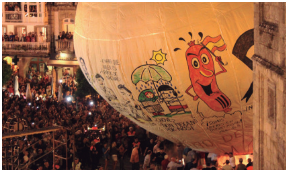
O Globo de Betanzos de 2013.

os propios artistas, supoñendo que conservasen un arquivo do seu labor. E con isto dou entrada ao último aspecto do tema que estamos a tratar.