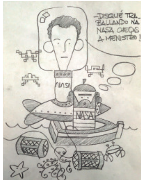
Bosquexo feito a lapis en papel dunha viñeta de Galán con destino ao Globo do ano 2018, na que aparece a caricatura do astronauta Pedro Duque.