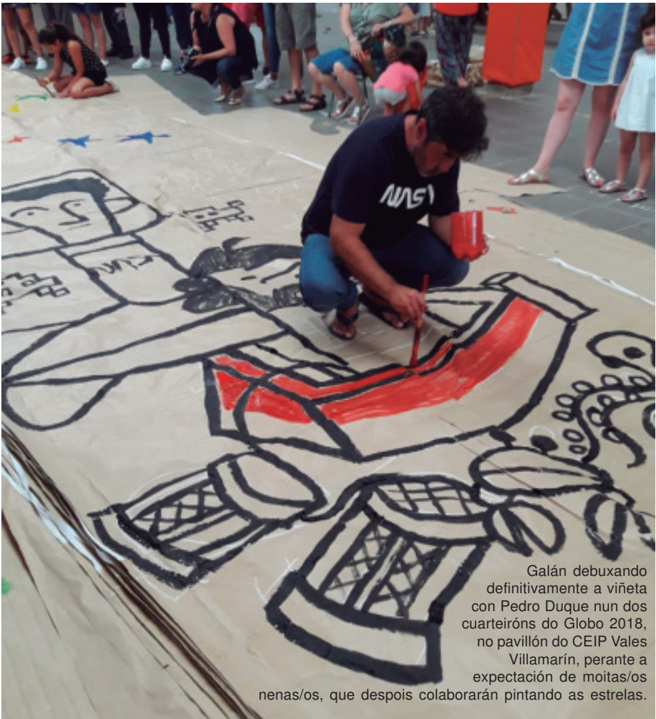
Galán debuxando definitivamente a viñeta con Pedro Duque nun dos cuarteiróns do Globo 2018, no pavillón do CEIP Vales Villamarín, perante a expectación de moitas/os nenas/os, que despois colaborarán pintando as estrelas.