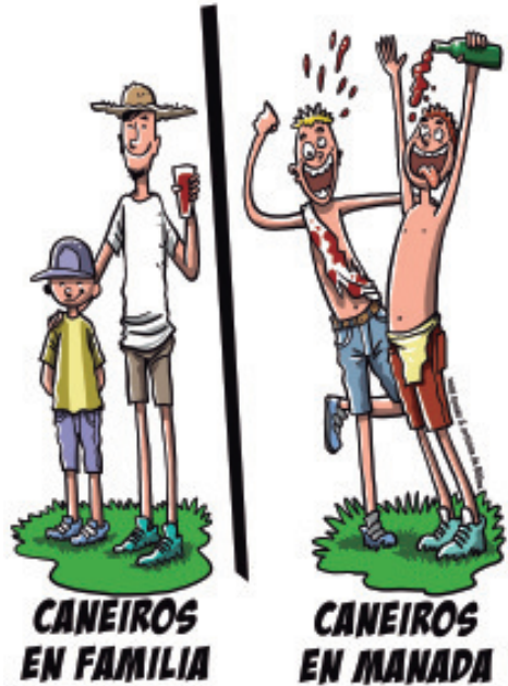
Cadriño de Xosé Tomás para o Globo do ano 2015, referido á problemática creada coa foma de celebrar os Caneiros.