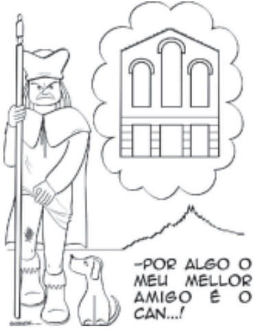
Cadriño de Andrade para o Globo do ano 1984, referido á desacralización da igrexa de San Roque para convertirse en sede de Caixa Galicia (hoxe Abanca)