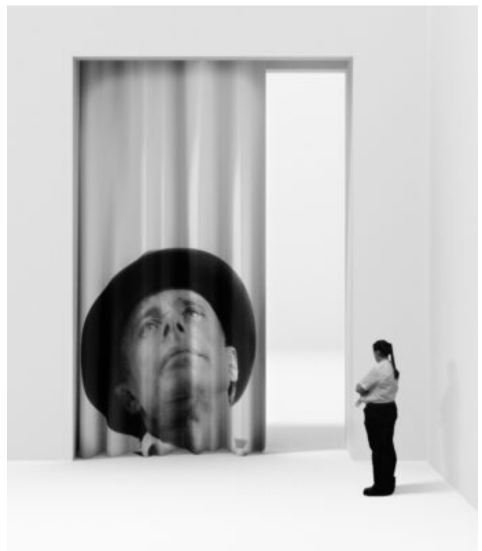
Imatge: Joseph Beuys, artista i professor de l'Escola de Belles Arts de Düsseldorf, tenia un fort compromís amb la idea l'educació com un dret fonamental de l'ésser humà.

Continuem amb una proposta per a totes aquelles institucions culturals que creuen que el departament educatiu és el departament que programa activitats infantils. Perquè un departament d'educació «funcioni» realment com a educatiu, hauria de deixar de banda el seu nom de «departament pedagògic/educatiu» i passar a dir-se «departament d'investigació educativa» i, amb això, començar a considerar els seus programes com a projectes d'investigació, afegint en el pressupost dels projectes els honoraris per a investigadors o altres agents que puguin acompanyar l'artista/mediador i que no el deixin sol davant dels conflictes del treball amb les comunitats, resoldre els seus dubtes i aterrar les seves idees en el context. A canvi el museu rep una experiència metodològica que es pot compartir amb altres institucions i contextos, i que és en definitiva la principal funció d'un departament encarregat de processos educatius: investigar si és possible generar una nova i millorada situació d'aprenentatge i ensenyança