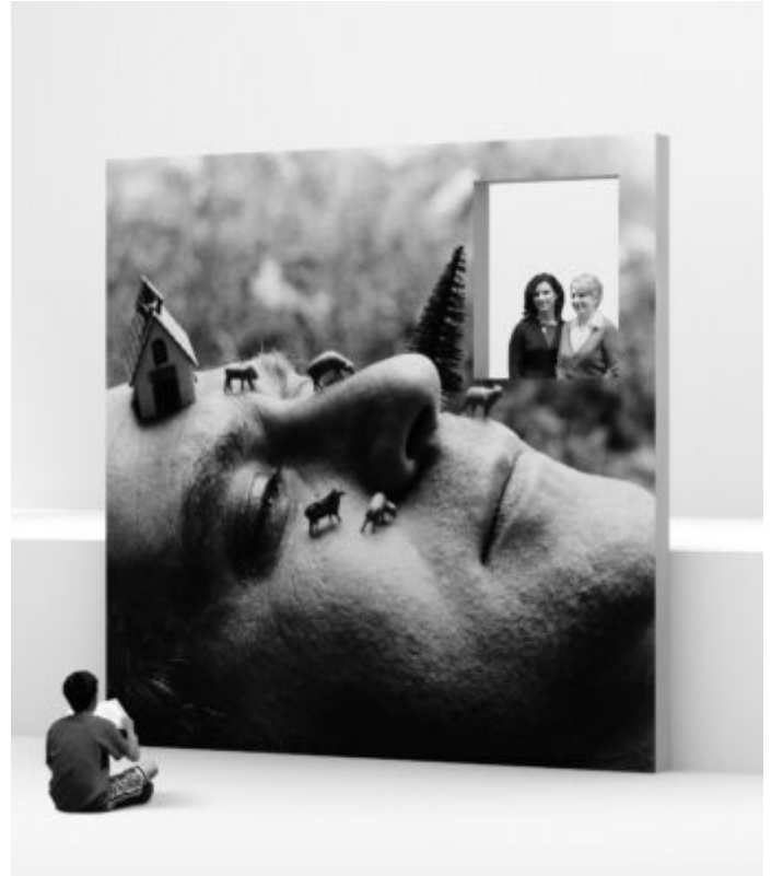
Imatge: "Landscape as an Attitude" (1979) de Luís Camnitzer.

Una condició bàsica perquè una pràctica de mediació sigui realment transformadora és, essencialment, disposar de temps, i això és una cosa que els educadors i els artistes hem d'exigir a les institucions on treballem. Els projectes en col·laboració amb comunitats necessiten processos de cocció lents, entre un i tres anys, i oblidem-nos de fer una exposició com a conclusió final. Visibilitzem i compartim els processos perquè el que ha sigut interessant en un context es pugui adaptar en un altre context; considerem el nostre treball una investigació artística i a la vegada educativa.