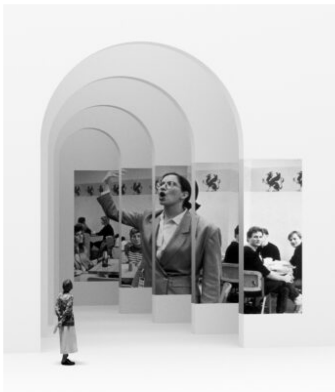
Imatge: Andrea Fraser a la seva performance "Museum Highlights: A Gallery Talk" (1989) on interpreta el paper d'una educadora de museus voluntària del Philadelphia Museum of Art.

Una altra cosa que hem oblidat és que els educadors tenim poder, i això és una cosa que el museu no té pressa a fer-nos recordar. A les seves sales ens convertim en el distribuïdor del seu discurs oficial i això ens legitima. Fem servir aquesta qualitat única per revelar les estructures de poder que circumscriuen la institució, perquè l'educació artística és una pràctica qüestionadora, i per tant els educadors som agents d'interrogació amb possibilitat de qüestionar