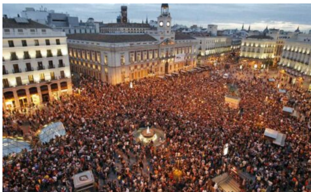
Imatge: 15M Puerta del sol, Madrid, 2011.

Del 15M a les Nuits Debout, passant per Act Up i les Femen, la protesta política a Europa sembla haver-se convertit tota ella a l'activisme. Grups autònoms emprenen accions espectaculars pel seu compte i sense la mediació dels intermediaris habituals. Allà on s'instal·len per un temps més o menys breu, despleguen tota la gamma de l'agitació activista: teatre de carrer, construcció de comunitats democràtiques radicals, boicot, propaganda, resistència a les expropiacions, escarnis, i un llarg etcètera.