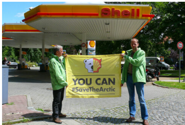
Imatge: Greenpeace München, You Can Save the Arctic.

Sembla que el model europeu de la protesta social, que utilitza la lluita col·lectiva i té com a objectiu la conquesta del poder, hagi donat pas, molt a poc a poc, a un model americà que afavoreix l'acció directa no violenta i té com a objectiu transformar les consciències. Aquest canvi s'ha produït en tres etapes: en primer lloc, durant les dècades dels 60 i 70, Europa descobreix les protestes de Martin Luther King i Malcom X, i els moviments hippies de Califòrnia i Nova York. A partir dels anys 80, una nova força política, l'ecologisme, fa evolucionar l'activisme i li dona un nou instrument: les ONG. Greenpeace i WWF utilitzen la gamma clàssica: boicots, acció directa, desobediència civil, i també postures ètiques com ara el vegetarianisme o altres formes de compromís de viure una vida senzilla. Predicar per l'exemple i transformar les consciències individuals tant o més que la societat.