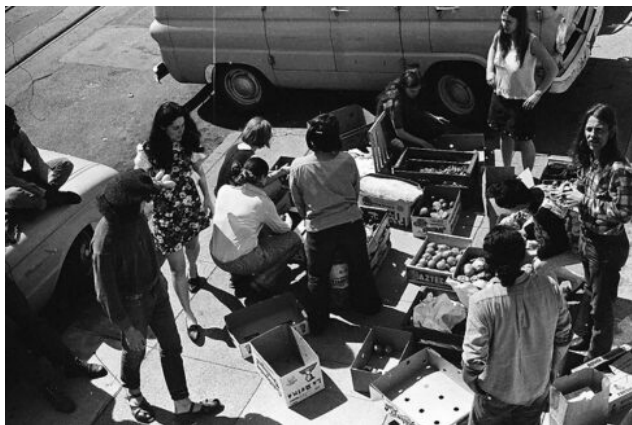
Imatge: Food distribution outside of home, Chuck-Gould.

És possible fins i tot que moviments activistes com les Femen, o les accions colorides dutes a terme davant de la COP21 de París, siguin caricatures de la veritable acció social transformadora popular, dissenyades expressament per crear confusió i diluir qualsevol reivindicació popular. Aquesta crítica, indubtablement la més dura de totes les que s'han fet a l'activisme, considera que l'activisme és un passatemps burgès tant inocu com qualsevol altre.