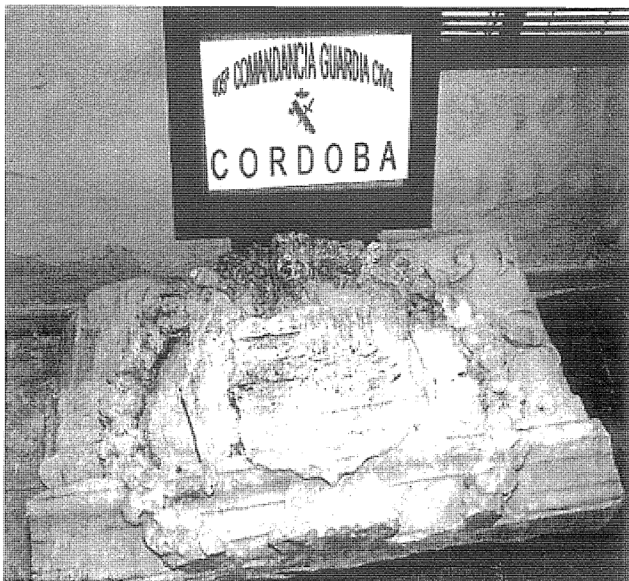
El escudo de los marqueses de Priego, tras ser recuperado por la Guardia Civil.

queda reflejado en la multitud de actos que se organizan. Mencionaremos las actividades más destacadas: