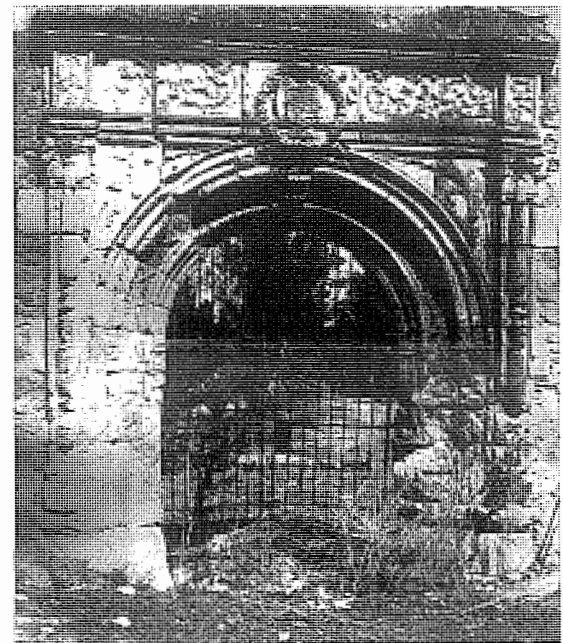
Portada del antiguo convento de San Lorenzo.