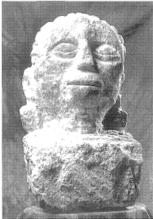
La Dama de Riotinto.