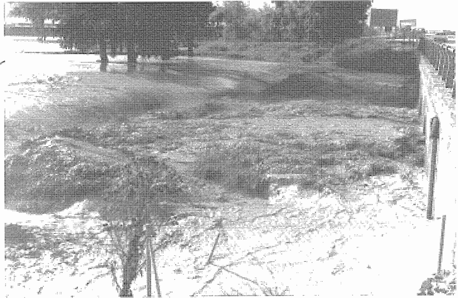
Riada del Arroyo Salado. Noviembre de 1997.

derecho y 3 m. el izquierdo; el más pequeño de la derecha tiene 2'60 m.