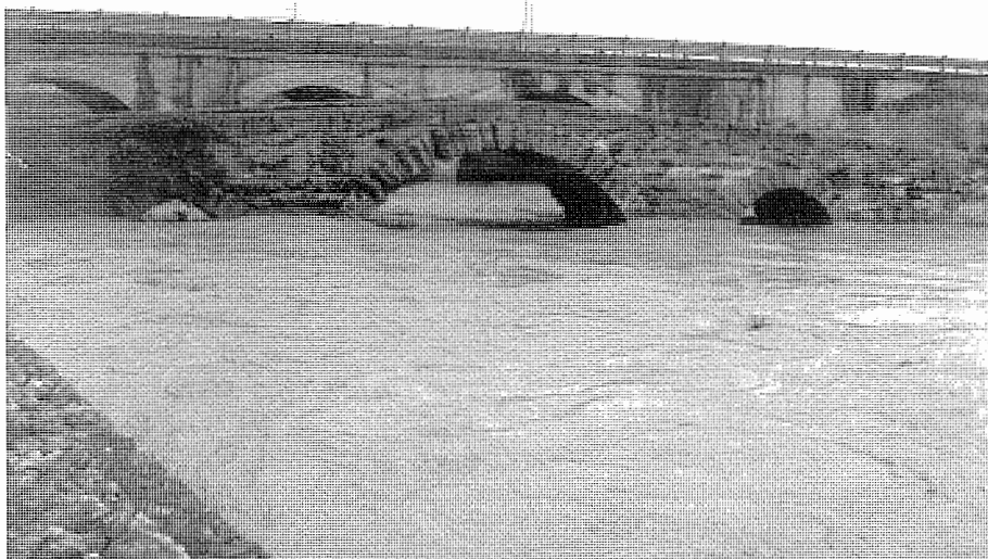
Riada del Arroyo Salado. Noviembre de 1997. En primer término el puente romano y detrás, el puente actual.

hispana, y él mismo nos indica que este fue el camino que utilizó Julio César en su persecución a los hijos de Pompeyo, para su posterior derrota en Munda (Montilla); este historiador describe cómo se desplazó en el increíble tiempo récord de veintisiete días desde Roma hasta Porcuna, lo que equivale a unos setenta y cinco kms. por día.