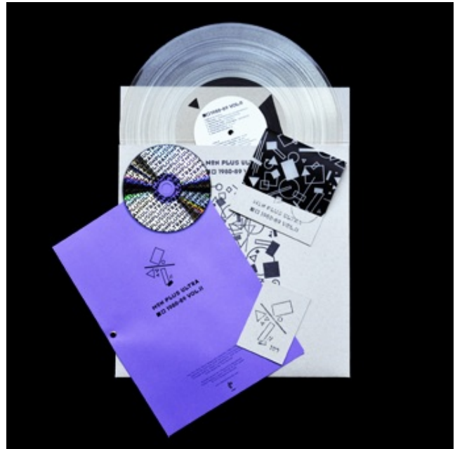
Edició del recopilatori Non Plus Ultra Vol.2 1980-1989. Tiratge de 100 còpies en vinil transparent, inclou targeta numerada i impresa manualment i dossier amb informació detallada.

El primer d'aquests elements és la voluntat i la necessitat d'oferir quelcom que tenia el convenciment que no existia. Recordo pensar molt sovint: «Si jo no ho faig, no crec que ningú s'hi atreueixi». Aquest pensament pot ser desmotivador o tot el contrari; depèn de com t'ho miris. En el meu cas, ho tenia molt clar. Ara bé, això és tan sols un aspecte més i, per molt fonamental que sembli, no m'hauria servit de res sense tenir un ampli coneixement del mercat on volia ubicar-me. Saber quins canals de promoció i distribució són els més utilitzats, conèixer molt bé els teus competidors o companys i saber a la perfecció quin producte ofereixen, quins són els seus punts forts i els seus punts dèbils... En aquest sentit, em va ajudar moltíssim el fet de ser, des de feia anys, un fervent i compulsiu comprador de vinils i, per tant, algú qui estava molt al corrent de tot el que es movia en aquesta indústria (que és molt petita, per cert).