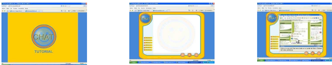
Fig.3. Pantallas correspondientes al tutorial para aprender a utilizar el Chat.

llegue al conocimiento de la temática en función de su desarrollo cognitivo. En este sentido, el Prototipo Virtual posee en su desarrollo, en el Segundo Módulo Educación Multimedia, tres tutoriales.