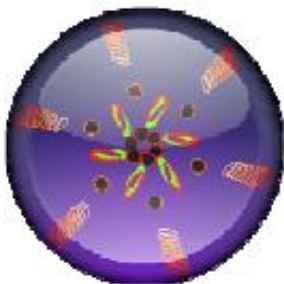
Figura 1: Metáfora que radica todos los contenidos, interfases y menús de la Hipermedia.