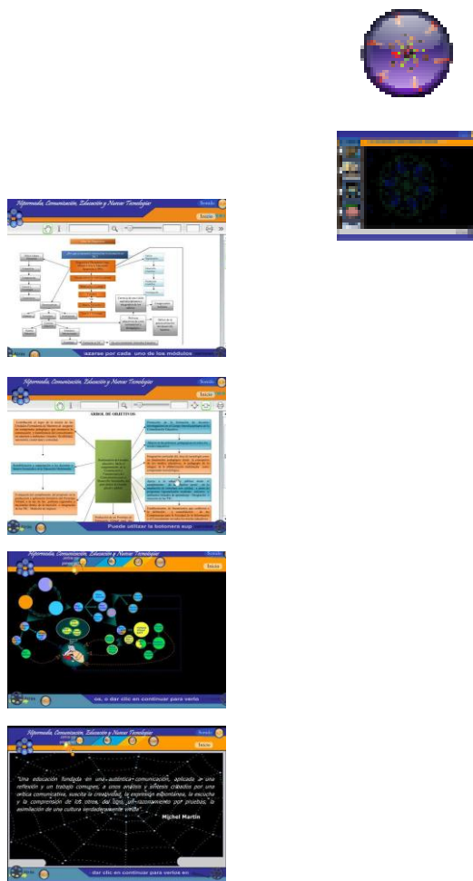
Fig. 7. Matriz gráfica del Prototipo Virtual