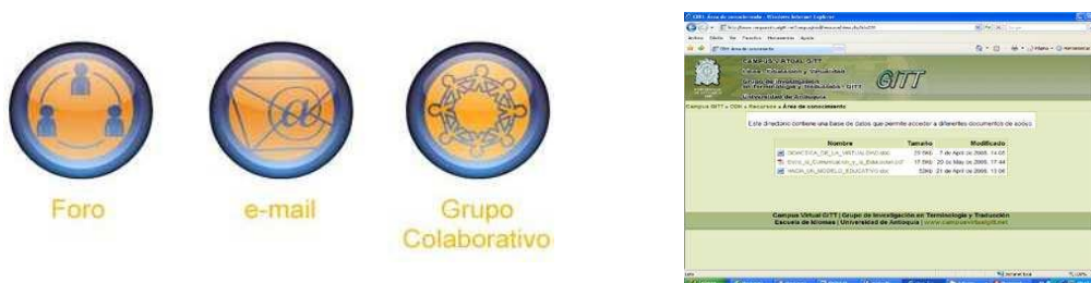
Fig.9. Logos correspondientes a los botones de las estrategias de comunicación del Prototipo Virtual.

Desde los diferentes ejercicios planteados en los seis módulos, los estudiantes tienen la posibilidad de llamar (abrir) el Bloc de Notas y desde allí realizar las diferentes actividades y guardarlas en el disco duro para enviarlas luego, bien sea por el E-mail del Campus Virtual GITT o directamente por la Plataforma. Igualmente este Sistema Virtual presenta la opción de administrar las evaluaciones tanto de tipo sumativo como formativo (retroalimentación) en la interacción con los alumnos.