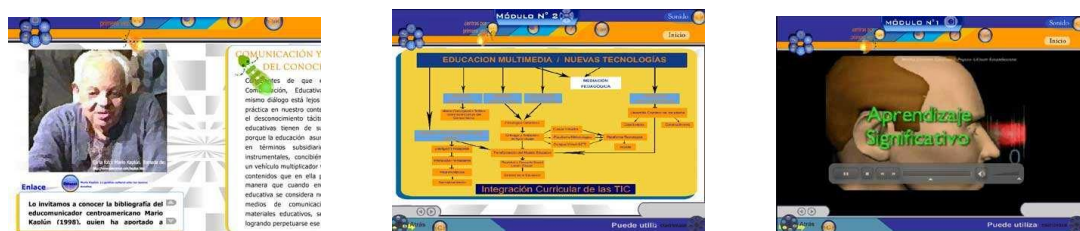
Fig.8. Pantallas correspondientes a los diferentes módulos del Prototipo Virtual.

Las tipologías seleccionadas fueron dos: Goudy Old Style y Tahoma . La primera, de buen tamaño y grosor, perfecta para los títulos principales de la Multimedia ya que permite destacar bien los textos y facilita la lectura gracias a la terminación serif de sus perfiles. La segunda, Tahoma , una letra sencilla de líneas delgadas y delicadas, de buen tamaño y espacio entre caracteres para hacer más agradable y descansada la lectura en la pantalla de la información general que conforma el cuerpo teórico del Prototipo Virtual.