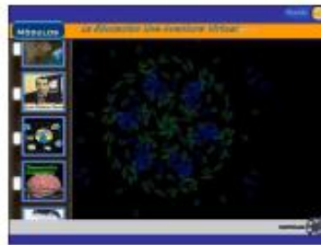
Figura 2: Carátula cara posterior del CD-ROM Hipermedia Educativa: La Educación una Aventura Virtual

El propósito implícito en el proyecto es establecer una caracterización del uso e integración de las TIC en el campo educativo, dentro de la necesidad de un modelo pedagógico que englobe las características y aplicación de las TIC de acuerdo con las competencias requeridas para la sociedad de la información y el conocimiento.