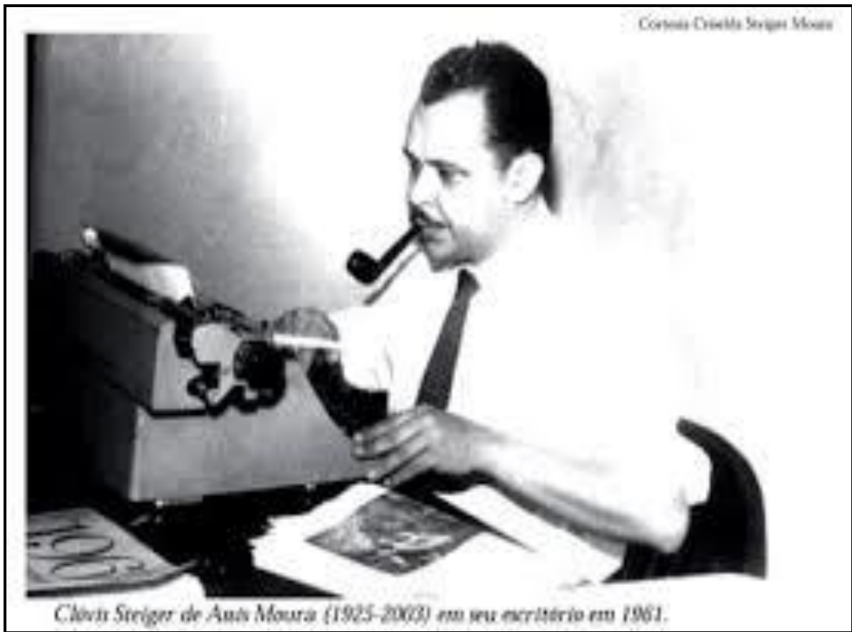
(Foto 1: Foto de Clóvis Moura que estampa a capa do CD ROM em sua homenagem intitulado “Clóvis Moura-Fragmentos de Vida e Obra” 1 ).

aos vinte e três anos de idade. Livro este que se tonaria um clássico da historiografia alguns anos mais tarde.