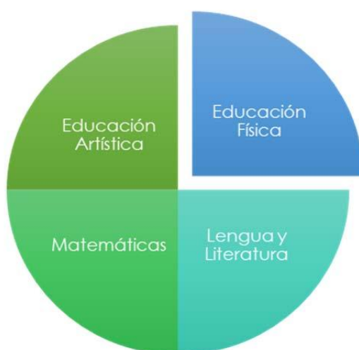
Figura 1. Interdisciplinariedad del proyecto.

Así pues, a través del área de Educación Física, y trabajando al mismo tiempo contenidos pertenecientes a los ámbitos de Lengua y Literatura, Matemáticas y Educación Artística, se puso en marcha un proyecto interdisciplinar en el que el máximo protagonismo fue asumido por el alumnado de 6º de primaria del centro (Figura 1). Según establecen Mérida, Barranco, Criado, Fernández, López y Pérez (2011), las relaciones existentes entre las diferentes áreas de conocimiento se producen en función de las necesidades que surgen con el fin de mejorar la realidad.