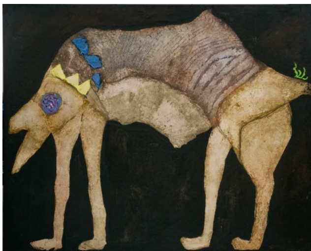
La bête de Gevaudan I, 2013.