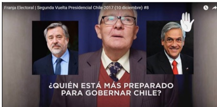
Figura 3 Piñera vs. Guillier: ¿quién está más preparado para gobernar Chile?

En cuanto al segundo candidato analizado, Alejandro Guillier no se refiere a la educación inclusiva en su programa escrito de gobierno; solo alude a la “integración” de niños con necesidades especiales (p. 18), lo que contrasta teórica y políticamente con el posicionamiento inclusivo, como se explicó en el marco teórico. Sin embargo, Guillier expresa su perspectiva sobre la inclusión en su franja televisiva, a través de la idea de “sociedad inclusiva”. Con respecto al logro de una educación inclusiva y de calidad, en el programa escrito de gobierno, Guillier propone una