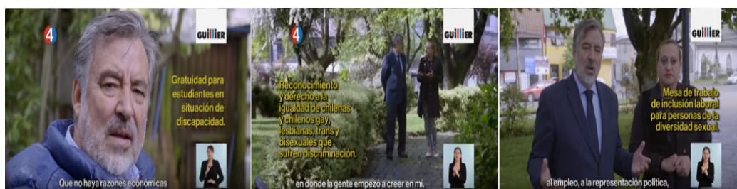
Figura 5 Alejandro Guillier conversa con personas con discapacidad y personas transgénero

El candidato instancia sus evaluaciones a través de diferentes apreciaciones positivas enunciadas mediante ideas escritas (“que no haya razones económicas que impidan estudiar”, “Gratuidad para estudiantes en situación de discapacidad”, “Reconocimiento y derecho a la igualdad de chilenas y chilenos gay, lesbianas, trans y bisexuales que sufren discriminación”, “Mesa de trabajo de inclusión laboral para personas de la diversidad sexual”). El modo semiótico verbal se combina con las imágenes de personas vulnerables y discriminadas, quienes dan su testimonio para reforzar el discurso del candidato a favor de ellas.