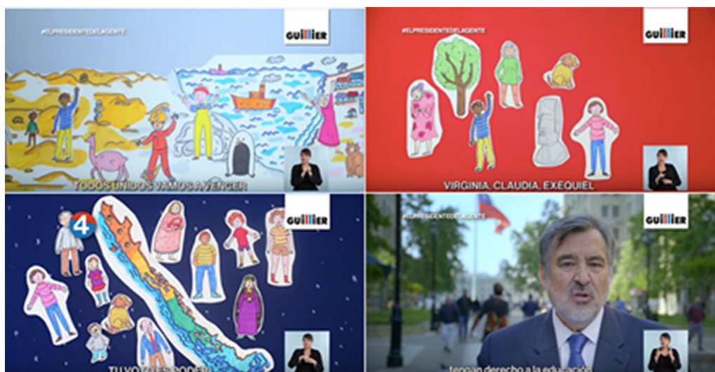
Figura 4 Certezas e incertidumbres de Alejandro Guillier

Desde la perspectiva representacional, la franja de Guillier muestra tres imágenes (véase Figura 4) de estilo naif , que representan diferentes actores sociales de Chile de distintas edades (niños, jóvenes, adultos mayores), así como fenómenos geográficos y naturales de este país: regiones, mar, playa, guanaco y moai. En la cuarta imagen se observa al propio Guillier hablando, mientras aparece como fondo desenfocado el Palacio de la Moneda, con la técnica cinematográfica de profundidad de campo , que le permite mostrar la llegada a esa casa de gobierno como un hecho que cae en la incertidumbre. En otras palabras, las certezas, representadas por los personajes, objetos, animales o lugares típicos de Chile en la franja de