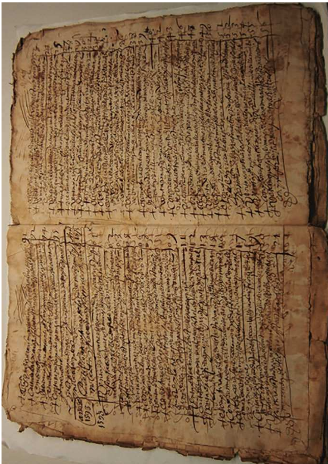
Folio 7 vtº y 8 del Inventario