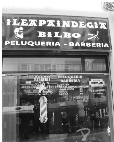
Figura 1 Signo mixto, con asignación lingüística de funciones (comercial)

necesidades de comunicación efectivas con el receptor. Cuanta mayor exposición tenga una lengua minoritaria en la sección informativa, mayor será