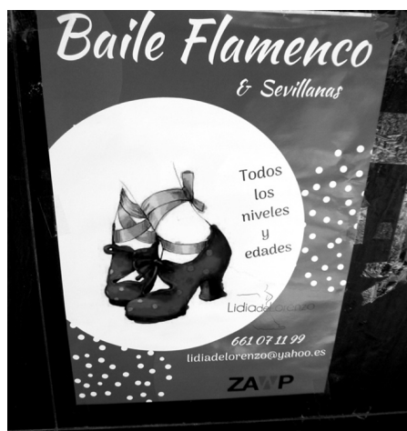
Figura 3 Texto en español