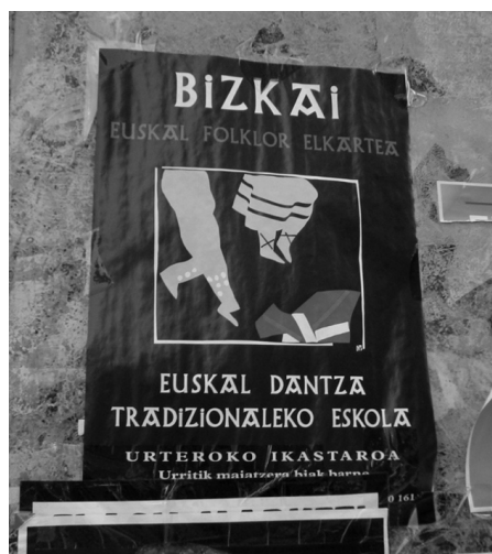
Figura 4 Texto en euskera