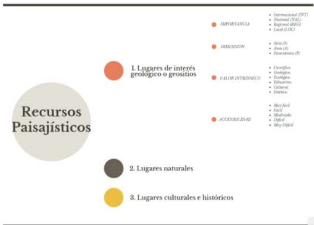
Imagen 6. Clasificación y subclasificación de los recursos paisajísticos.