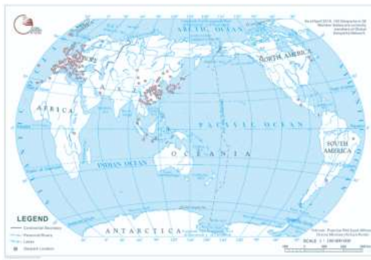
Imagen 1: Mapa de los miembros de la GGN al 2018.