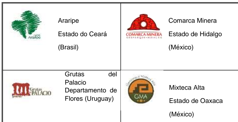
Imagen 3. Geoparques fundadores de la Red GeoLAC