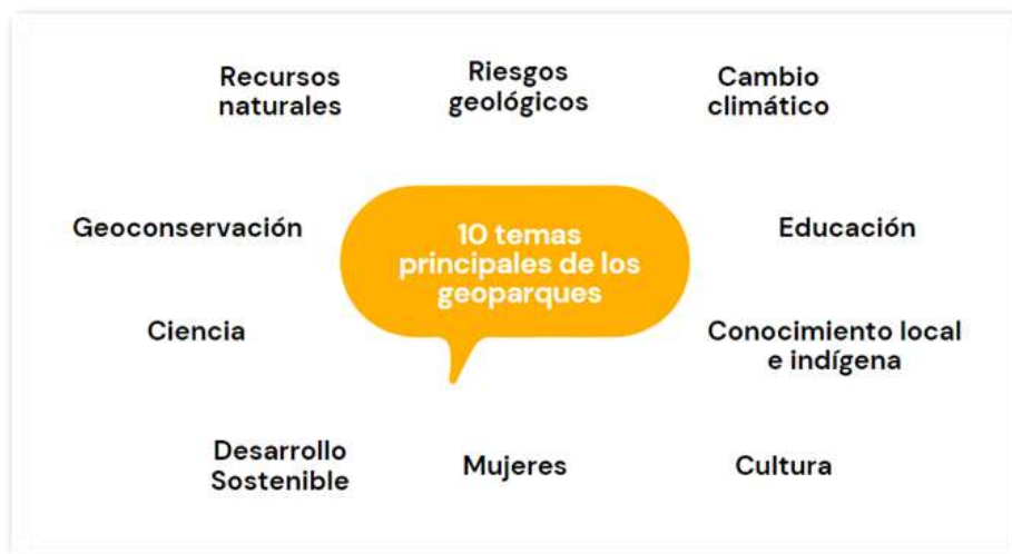
Imagen 2. Los 10 temas principales de los Geoparques.

Como se mencionaba líneas arriba, un Geoparque no sólo es geología, sino que se conceptualizan como territorios que conservan y promueven el patrimonio natural y cultural de un lugar mediante estrategias y actividades de desarrollo sustentable local (Palacio et al., 2018), de ahí que el gran beneficio de este tipo de figura territorial sea la posibilidad de integrar las diferentes realidades de la zona en una propuesta completa, donde la geoconservación aporte a la mitigación de amenazas o la mejora de las fortalezas del lugar; es por eso que además de tener como eje central a las formaciones geológicas, este tipo de parques atienden a diez principales temas, pudiéndose enfocar a uno de éstos o varios, y los cuales se representan en la figura 1: