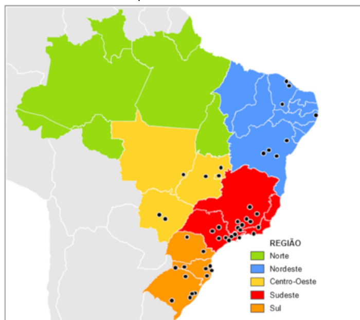
Figura 1 – Localidades que receberam PDCs entre 2013 e 2017