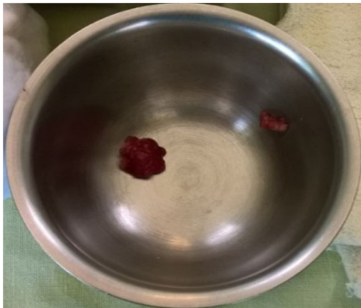
Figura3: Saco quístico (aneurisma) resecao de 17x7.7 mm

Es extraño que los traumatismos de los tejidos blandos de la cara sean urgencias quirúrgicas, y para evitar desfiguración facial debemos dar tratamiento temprano. En el trauma ya sea contuso o penetrante de la región parotídea, la compleja anatomía (nervio facial y conducto parotídeo) se dañan fácilmente por su relación cercana con la superficie y se debe buscar evidencias de lesiones que pueden llevar a múltiples complicaciones, entre las cuales se mencionan a la parálisis del nervio facial por