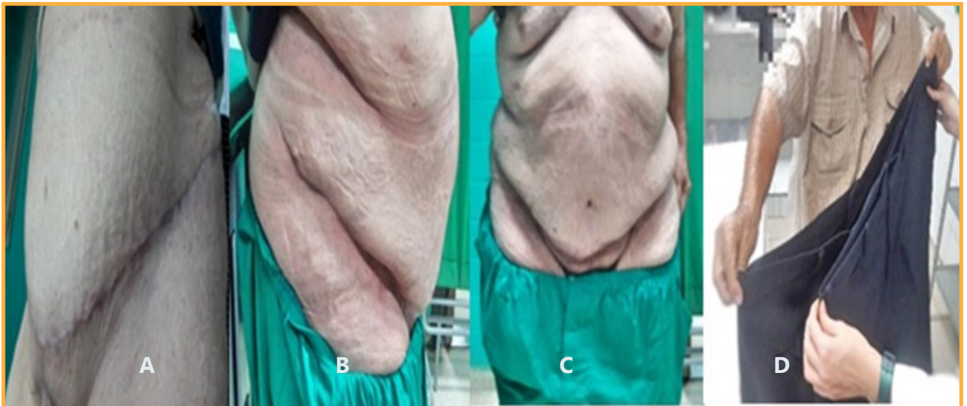
Figura 3: Postoperatorio a los 21 días aún sin retirar suturas (A). Vease la ausencia de zonas cruentas o granulomas. Vistas lateral (B) y frontal (C) a los 30 días postoperatorios. Paciente mostrando reducción del perímetro abdominal a los tres meses (D).