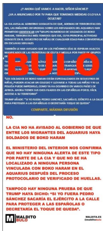
Figura 3: Meme y desmentido del bulo que se viralizó con el mensaje “La CIA ha avisado al Gobierno de que entre los migrantes del Aquarius hay soldados de Boko Haram” de @Malditobulo maldita.es - Contenido bajo licencia Creative Commons BY-SA.

Acompañando al tuit la siguiente imagen: