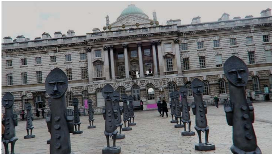
Figura 1 – Somerset House London ao fundo. Em primeiro plano obra de Zak Ove (1966), The Invisible Man and the Masque of Blackness , (2016).

Diante desse panorama, Touria criou a feira 1:54 Contemporary African Art Fair , que teve sua primeira edição em 2013, em Londres. O local escolhido foi o imponente palácio neoclássico às margens do rio Tâmis, Somerset House (Fig. 1), que também já havia abrigado a Royal Academy. 4