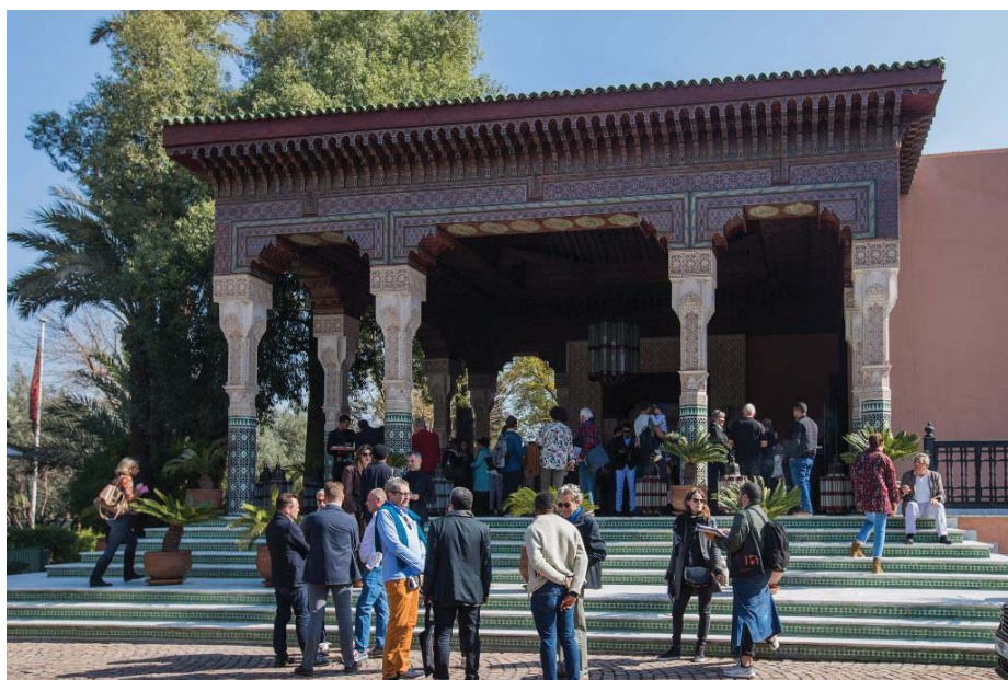
Figura 3 - 1:54 de Marrakesh, Marrocos 2018. La Mamounia Hotel local da feira.

O segredo de uma obra de arte que atinge seu objetivo é que ela nos sensibiliza. Seja qual for o suporte que o artista tenha escolhido usar, quaisquer que sejam os conceitos muito pessoais que contenha, a obra tocará aquela parte de nós que define a nossa empatia com o objeto. Sem dúvida, é por isso que nem sempre será fácil abordar a contemporaneidade na África.