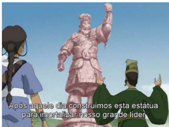
Imagem 1 – O prefeito mostra a estátua de Chin a Katara e Sokka Fonte: Série Avatar: a lenda de Aang – Episódio 5

Assim, o episódio retrata de forma fictícia a construção histórica do passado dessa comunidade, que responsabiliza o líder morto Chin por seus grandes feitos, tornando este um herói, e elege como vilão o avatar, demonstrando também a forma como relembram e perpetuam a memória do ocorrido.