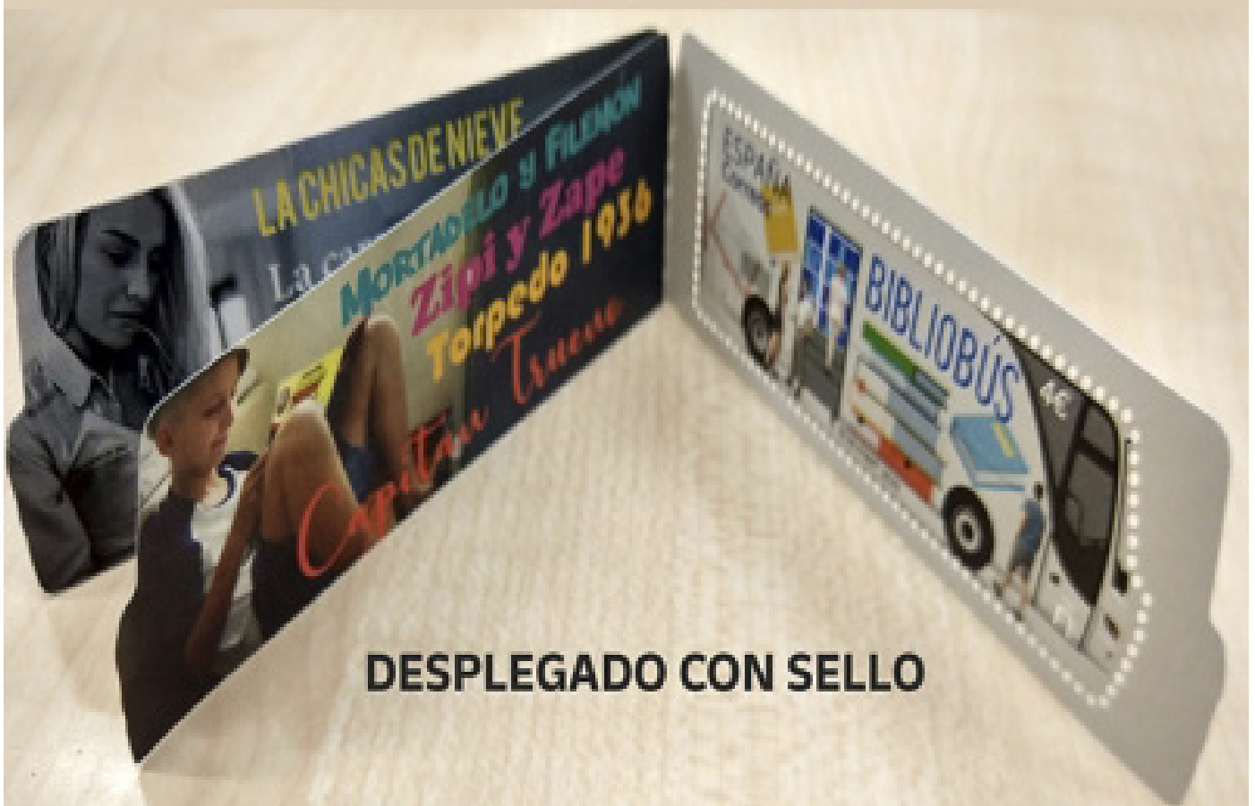
DESPLEGADO CON SELLO