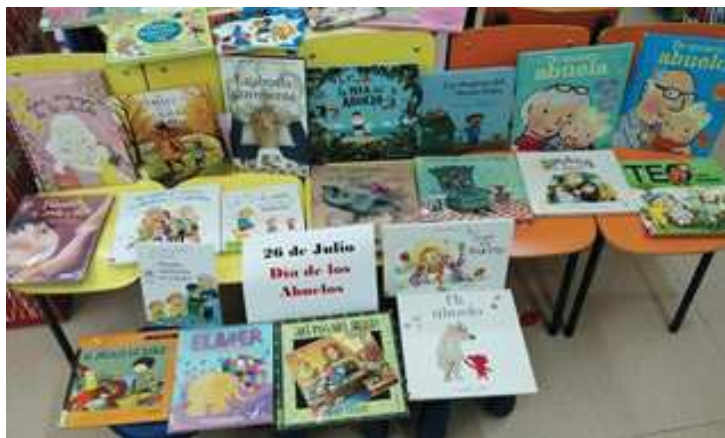
Biblioteca de Gallur