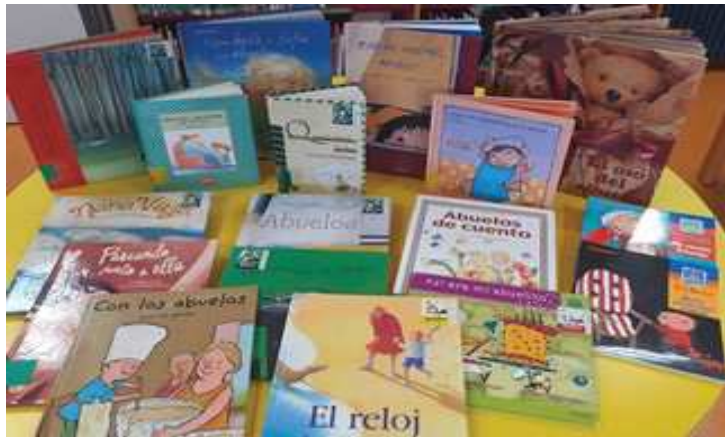
Biblioteca de La Roda