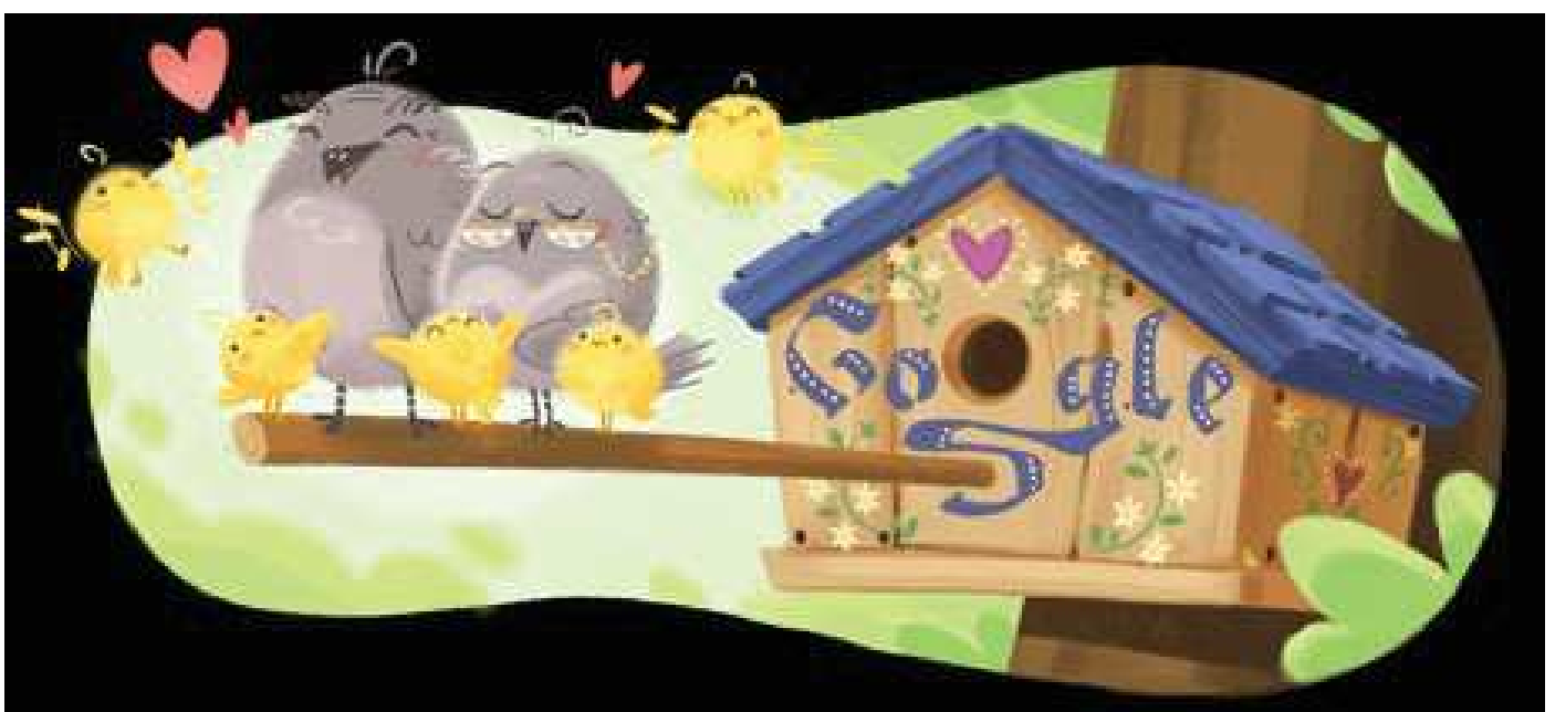
Doodle de Google “Día de los abuelos 2.020”