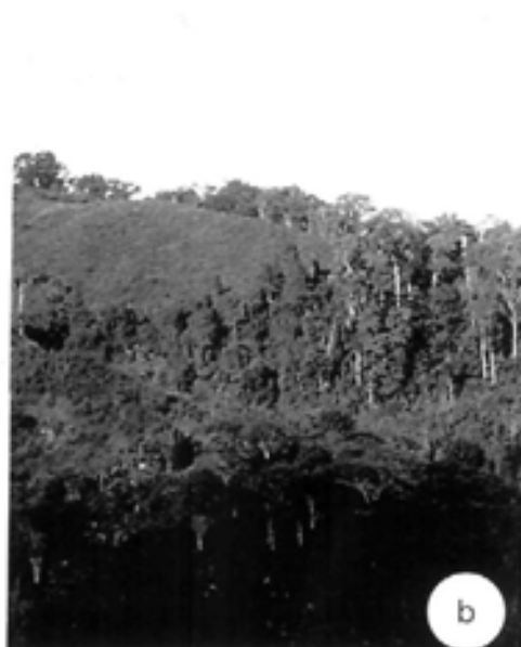
Fig. 2.-a, panorámica de Cerro Pintado (La Guajira), visto desde el páramo de Sabana Rubia; b, aspecto de una franja modificada de bosque subandino, municipio de Agustín Codazzi (Cesar).

Perijá (RANGEL-CH., 1997b), donde ya se establecen diferencias significativas entre las formaciones vegetales que aparecen en las distintas franjas del lado colombiano, resultados que son acordes con otros estudios regionales previos (CUATRECASAS, 1958; RANGEL-CH., 1997a, 2001). En lo referente a la franja tropical, está dominada por sectores de bosque seco tropical y corredores de bosque de galería, siguiendo los diferentes cursos de agua de la vertiente; en la franja subandina y andina predominan bosques de niebla, cuya composición varía según los sectores (más o menos húmedos) y altitudes, destacándose en las zonas altas la dominancia de especies de Cunoniaceae ( Weinmannia ), Magnoliaceae ( Talauma ), Melastomataceae ( Meriania ), Theaceae ( Freziera ) y Styracaceae ( Styrax ), entre otras. Por último, en la franja de subpáramo y páramo, se encuentran comunidades dominadas por Asteraceae ( Baccharis , Diplostephium , Espeletia , Pentacalia ), Erica-