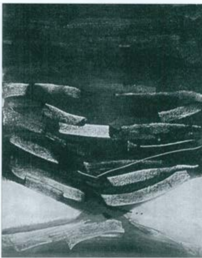
Pintura. 1959, oli sobre tela. MAS. Tercer Premi de la Quarta Biennal de Belles Arts de 1959.