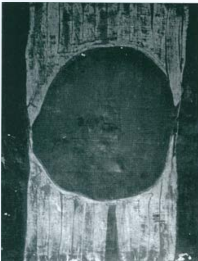
Cosmogonies. Sèrie Negra. 1959, tècnica mixta. Acadèmia de Belles Arts de Sabadell.

També és ella qui marca unes etapes del pintor, analitzades i descrites formalment, dividides en cinc períodes 1956-57; 1958-62; 1963-67; 1968-70; i finalment el període 1970 [-76]. Aquestes etapes, matisades posteriorment per J. Corredor-Matheos, sobretot amb gran abundància d'il·lustracions, serveixen per fer-se una idea prou clara de la trajectòria de l'artista. Però són sens dubte A. Cirici Pellicer i J-E Cirlot els crítics i amics que més profundament el van entendre i el van ajudar a projectar-se. El 1974, reflexionant sobre la trajectòria de l'artista J-E Cirlot comentava: "Por tanto diremos que, a nuestro juicio, toda la primera época de Vallès (1956-1966, a grosso modo) es la expresión de una ideología gnóstica; ideología de la cual no es responsable su autor, o su víc-