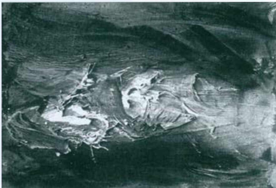
Serie EON 1962 a. 1962, Oli sobre tela. MAS. Tercer premi de la Biennial de Belles Arts de 1967

Per a tots els pintors del nucli barceloní, aquest va ser un moment de crisi profunda, que de cop desacreditava tot l'anterior i obligava a situar-se en una nova perspectiva.