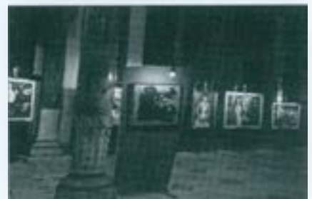
Aspecte del Saló Revista a La Caixa de Sabadell, 1957.