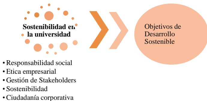
Figura 2. Enfoques prácticos de referencia para abordar la sostenibilidad en las organizaciones

De hecho, es fácil identificar cómo estos cinco enfoques diferentes tienen tanto en común que a menudo las organizaciones y los directivos los utilizan de forma indistinta (Setó-Pamies & Papaioikonomou, 2020). En la actualidad, la responsabilidad social (RS) parece ser una de los enfoques más comunes y las organizaciones la utilizan con mayor frecuencia, por lo que vale la pena comprender su alcance conceptual. De esta manera, la RS se posiciona como uno de los principales puntos de referencia inicial para la implementación de los ODS en las universidades.