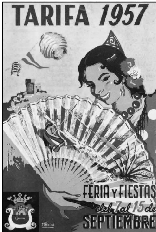
Portada del programa de la feria y fiestas de Tarifa de 1957, obra de Manuel Reiné.

Desde Estocolmo nos llega la noticia de que es posible que las explosiones ocurrieran en uno de los depósitos vacíos durante la limpieza cuando el barco se encontraba en el mar. ( Diario de Cádiz , 21 de agosto de 1957).