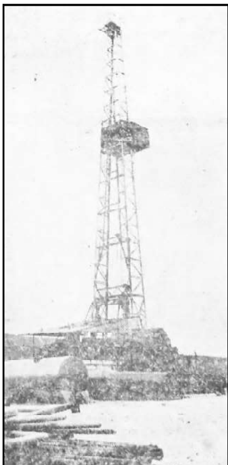
Torreta instalada en El Almarchal.

hasta ahora, todo hace concebir las mayores esperanzas. El suelo ha sido agujereado en más de mil metros, la instalación actual solo tiene posibilidades de alcanzar los mil quinientos y ya se ha pedido el mayor tren de sondeo existente en España, capaz para llegar nada menos que a cerca de los cinco mil metros.