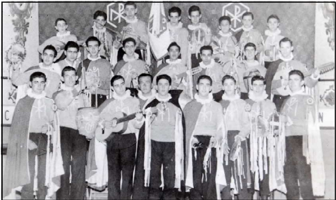
Coro de la Congregación Mariana.

Este coro juvenil obtuvo ya el pasado año un resonante éxito en sus actuaciones navideñas por la provincia gaditana, siendo de esperar que este año volverá a cosechar otros nuevos y resonantes éxitos. R. Sánchez. ( Diario de Cádiz , 7 de diciembre de 1957).