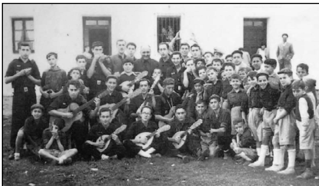
La rondalla del Frente de Juventudes en Tahivilla.

(23 de octubre de 1957). En el Hogar del Camarada y ante el jurado del Departamento Nacional de Extensión Cultural y Artística, actuó