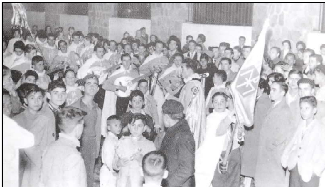
Coro de la Congregación Mariana actuando en la calle.

En la segunda parte de la función actuará el cuadro artístico de Radio Algeciras, que presentará variedades folklóricas.