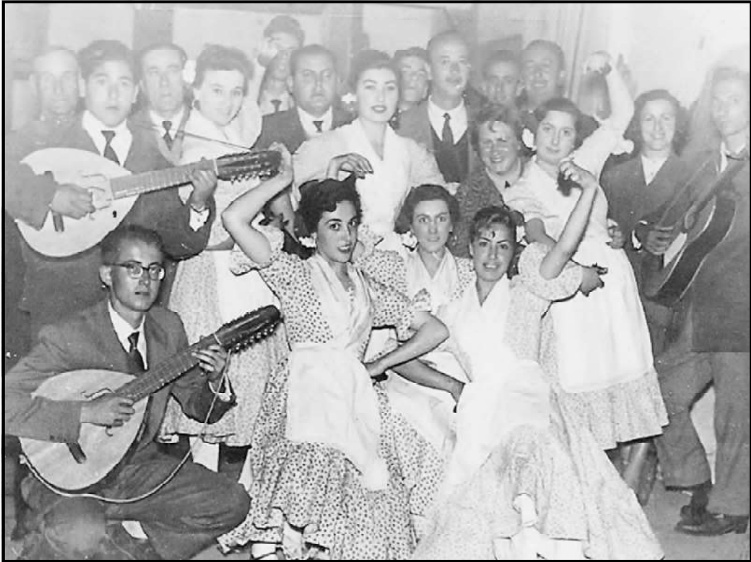
Miembros de los coros y danzas de la Sección Femenina.

Juventudes y por los coros y danzas de la Sección Femenina de Tarifa, cuya actuación fue largamente aplaudida por el numeroso público.