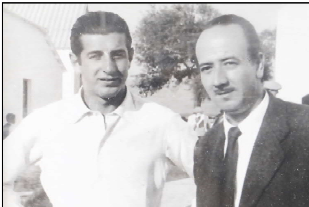
A la izquierda el matador de toros Antonio Ordóñez, promotor del festival benéfico. A la derecha el alcalde Juan Antonio Núñez quien con sus gestiones ha conseguido que vengan matadores de primera categoría a la plaza de Tarifa.

gestiones realizadas por el alcalde de Tarifa, Juan A. Núñez Manso, como también por la simpatía que por nuestra ciudad sienten los afamados espadas citados, siendo de resaltar que los hermanos Ordóñez y el Litri ya intervinieron el pasado año en otro festival. ( Diario de Cádiz , 13 de abril de 1957).