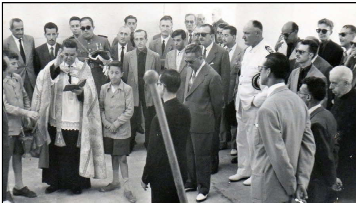
Bendición de las instalaciones del nuevo matadero municipal.