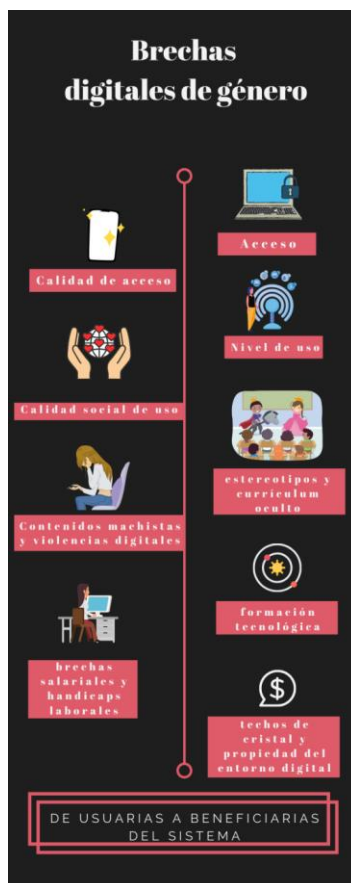
Fig. nº 2. Infografía de las brechas digitales de género.

El estudio Women in the Digital Age (EC, 2018) señala que las mujeres dejan su empleo en el sector digital mucho más que los hombres en la franja de edad de la maternidad (30 a 44 años). Según el mismo informe, el porcentaje de negocios del sector de la tecnología dirigidos por mujeres había decaído un 19% en 2015.