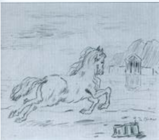
Cavall al costat d'un llac, 1927 Llapis sobre paper. 17,5 x 23,2 cm.