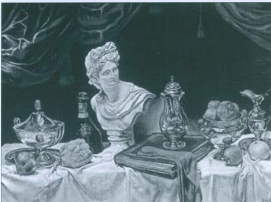
Vita silente con busto di Apollo, 1962

Giorgio de Chirico (Volo, Grècia 1888-Roma 1978) va ser el gran promotor del moviment, en el que es veuen influències del Cubisme. Però, malgrat això, De Chirico ho plasmava tot d'una manera molt especial. En les seves creacions s'aprecia el buit que es pobla de maniquies, d'estàtues creant una sensació en l'espectador d'enigma, d'estranyesa, de no saber realment què és el que es veu. D'aquí, d'aquestes sensacions ve la idea de que les seves obres siguin oníriques,