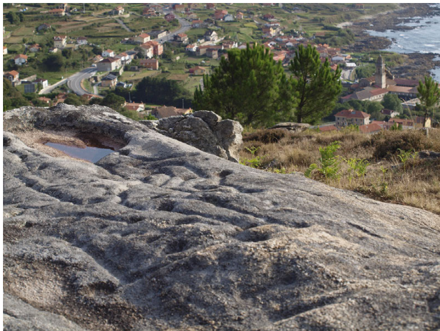
Fig. 9. Estación de A Pedreira en Oia (Pontevedra).

Las demás estaciones, que suponen la enorme mayoría del total, se ubican fuera de un área definida, y solamente señalizadas y marcadas en casos muy concretos, con un grado de dispersión muy elevado y que dificulta mucho la tarea de su gestión de manera íntegra (Fig. 9).