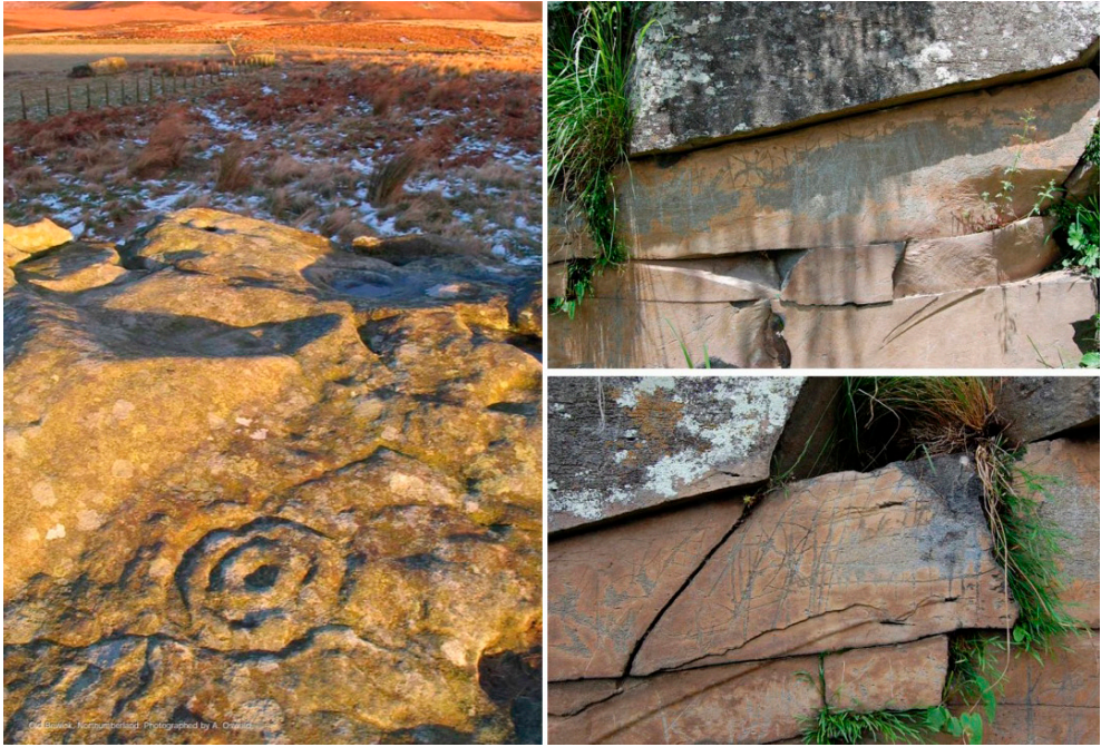
Fig. 6 (izq). Petroglifo de Old Bewick en el condado de Northumberland (Reino Unido).