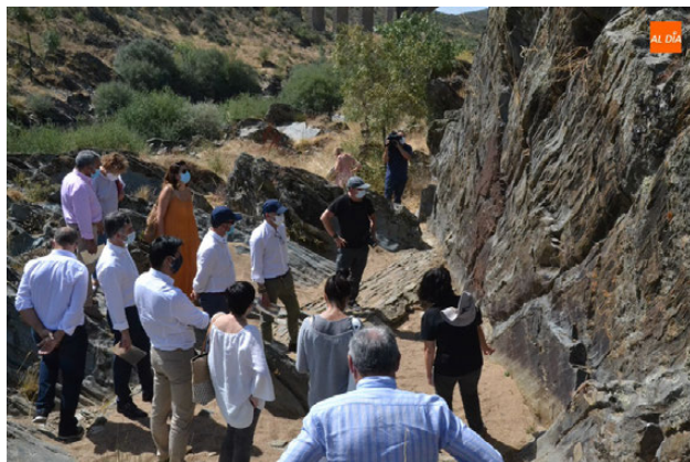
Fig. 5. Visita guiada en el área arqueológica de Siega Verde (Salamanca).

Bajando en la escala nos encontramos con el caso de Siega Verde en el nivel de protección alta (que es el único de los casos que no alberga grabados rupestres de la Edad del Bronce, sino del Paleolítico), representa el ejemplo más completo tras el primer nivel, faltando únicamente un plan integral de gestión y la localización en un área extensa de terreno (Fig. 5).