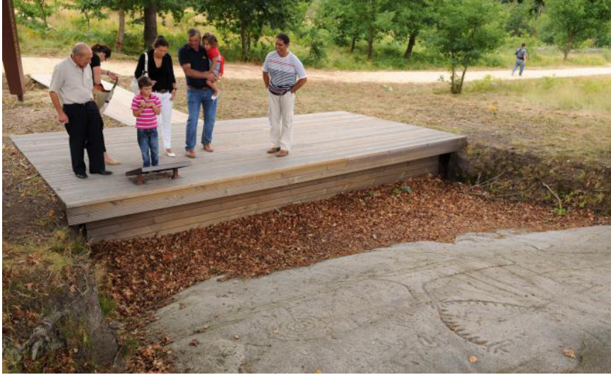
Fig. 8. Visitantes en la estación de Laxe dos Carballos, en el Parque Arqueológico del Arte Rupestre en Campo Lameiro (Pontevedra).