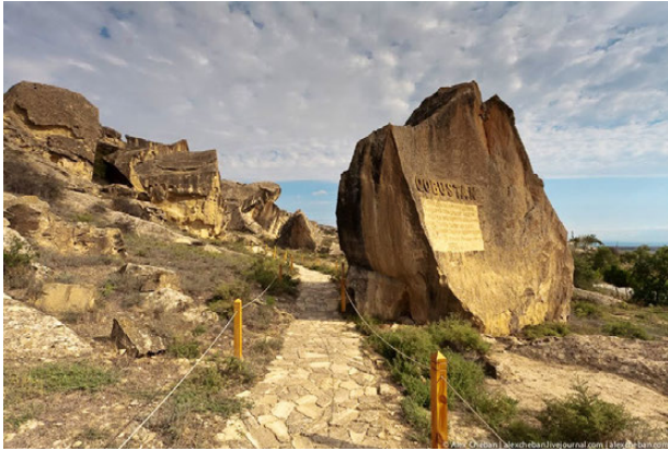
Fig. 3. Recorrido del Parque del Paisaje Cultural en Gobustán (Azerbaiyán).

del yacimiento, y de aquí se extraerá el contenido científico que se divulgará de cara a la sociedad.