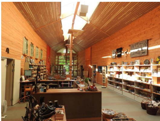
Fig. 4. Tienda del Museo de Vitlycke en Tanum (Suecia) .

talaciones para el trabajo técnico de limpieza, restauración, conservación e investigación científica que se debe desarrollar junto con las tareas de divulgación. A todo esto, se le pueden complementar más adelante actividades temporales como exposiciones, talleres didácticos, celebraciones especiales y otros recursos que atraigan nuevos visitantes (Fig. 4).