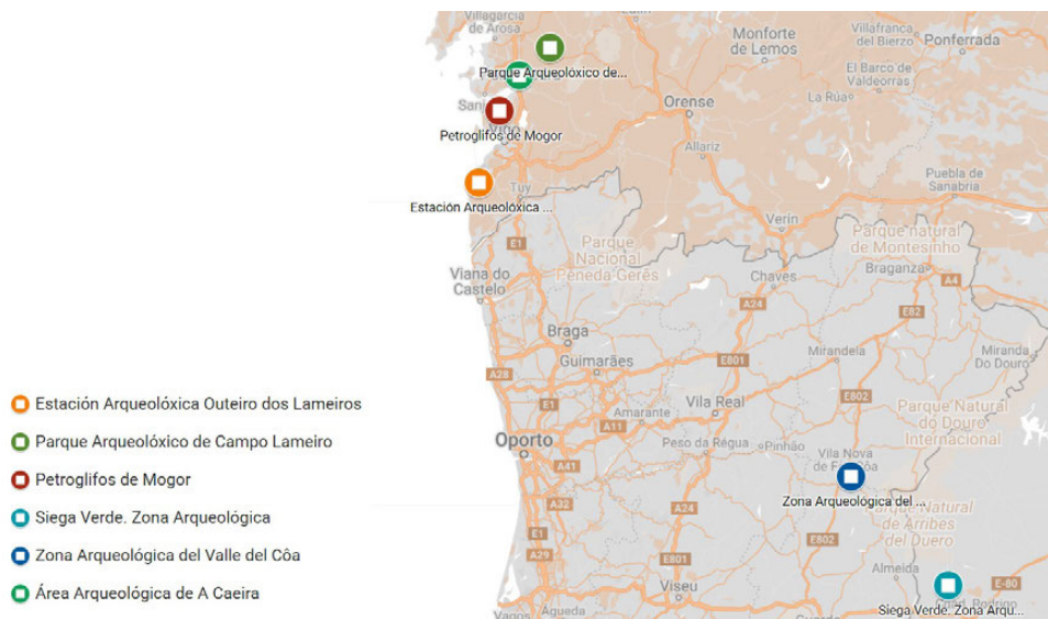
Fig. 1. Mapa de la situación de los lugares seleccionados en la Península Ibérica. Elaboración propia

estudio. Se debe tener en cuenta su estado, que lógicamente difiere dependiendo de las particularidades de cada caso. Dependiendo de estas circunstancias específicas, la aproximación de su gestión cambiará de manera acorde a estas, ya que requiere un tratamiento determinado a la hora de abordar su conservación y puesta en valor.