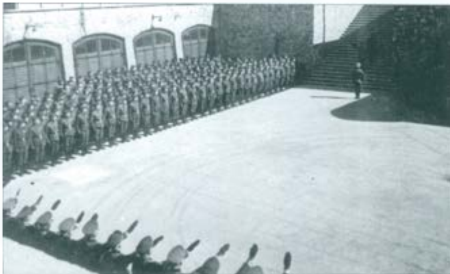
Formació de les SS a les cotxeres del camp