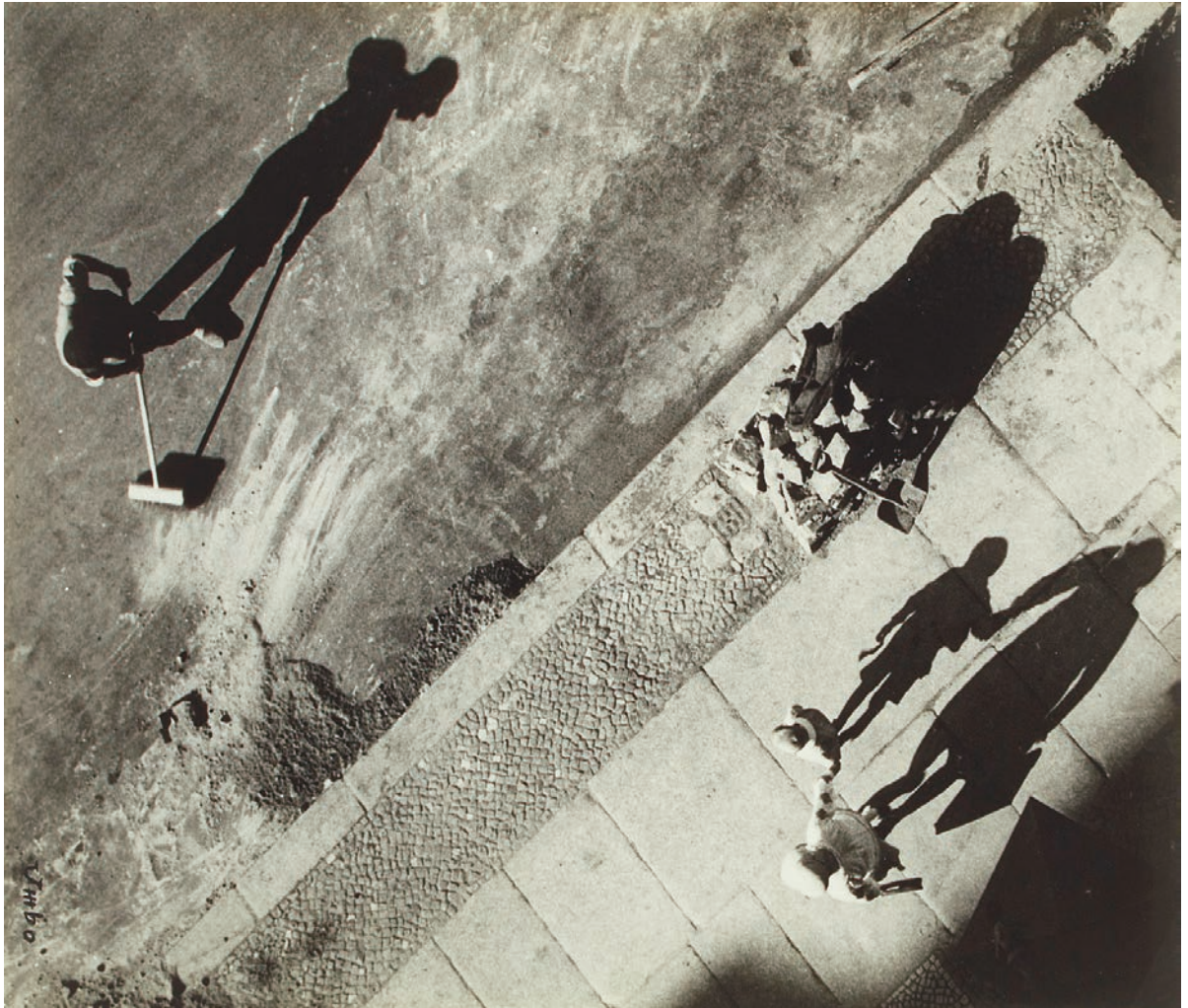
Otto Umbehr (Umbo), El misterio de la calle / The mystery of the street , 1928.

the difficulty of establishing boundaries for cities, it is worth adding that, nowadays, contemporary cities are not only defined by their centres—as is traditionally the case—but also, and especially, for what happens in their boundaries.