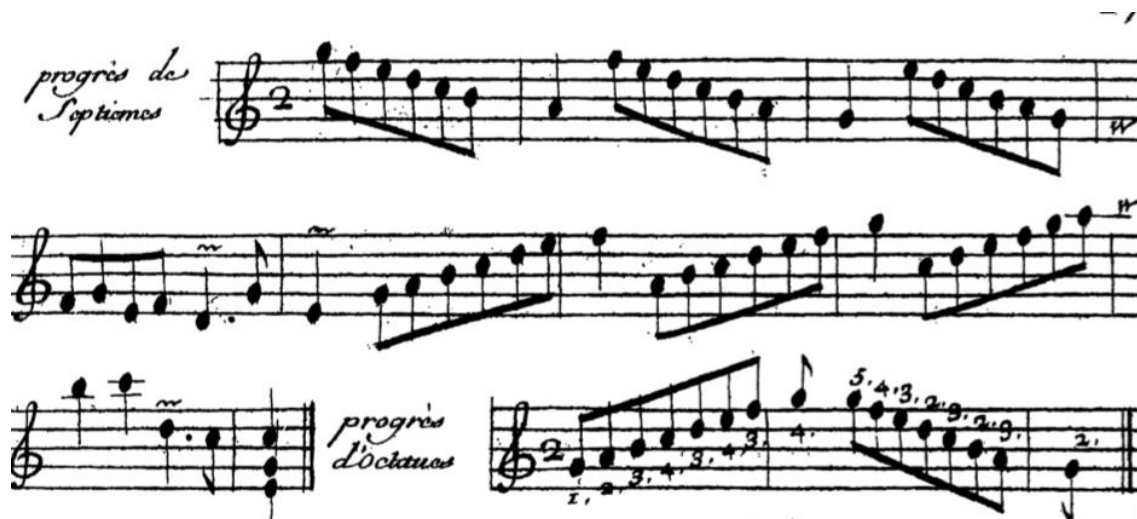
Figura No. 2. El Arte de Tocar el Clave, pg. 29

Realizado por François Couperin 4 (1668-1733). En ese método, publicado en el año 1716, se abordan aspectos como la digitación, pulsación, ornamentación e incluye ocho preludios como repertorio. Este método, es considerado uno de los más importantes en relación a la técnica de teclado francesa del siglo XVIII, puesto que incluyó el uso del pulgar en su digitación, ejerciendo una gran influencia en compositores posteriores como por ejemplo J.S. Bach.