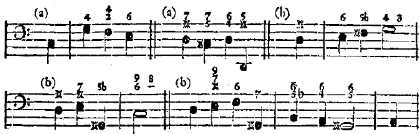
Figura No. 3. Ensayo sobre la verdadera manera de tocar el teclado.