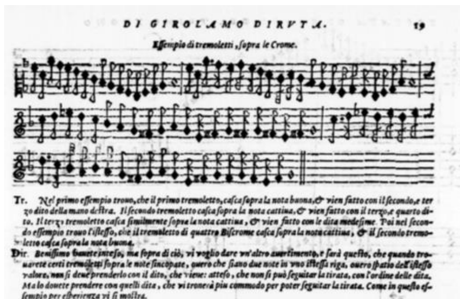
Figura No. 1. Método Il Transilvano, pg. 19.

Método creado por Girolamo Diruta 3 (1546-1624) . Il Transilvano , fue publicado en el de 1593 y su segunda edición en el año de 1609. Este método que surgió a partir de un diálogo que Diruta sostuvo con Istvan de Josíka, diplomático de Transilvania (de ahí su nombre), consiste en uno de los primeros tratados de la técnica tecladística para órgano. Uno de sus principales aportes es la digitación que presenta, la cual consistía en el cruce del dedo medio sobre el anular para pasajes escalísticos evitando el uso del pulgar.