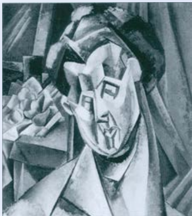
Bust de dona, amb natura morta al fons. Horta estiu del 1909.

tica. Són dignes d'esmentar els famosíssims : "La bassa d'Horta", "La fàbrica d'Horta", el "Retrat de Fernande", entre altres obres de menys projecció divulgada, però de no menys importància en la inspirada inventiva del geni malagueny, com "La muntanya de Santa Bàrbara", la qual, amb reminiscències cezànianes de la "Muntanya Sainte-Victoire", fou l'inici del cubisme picassà.