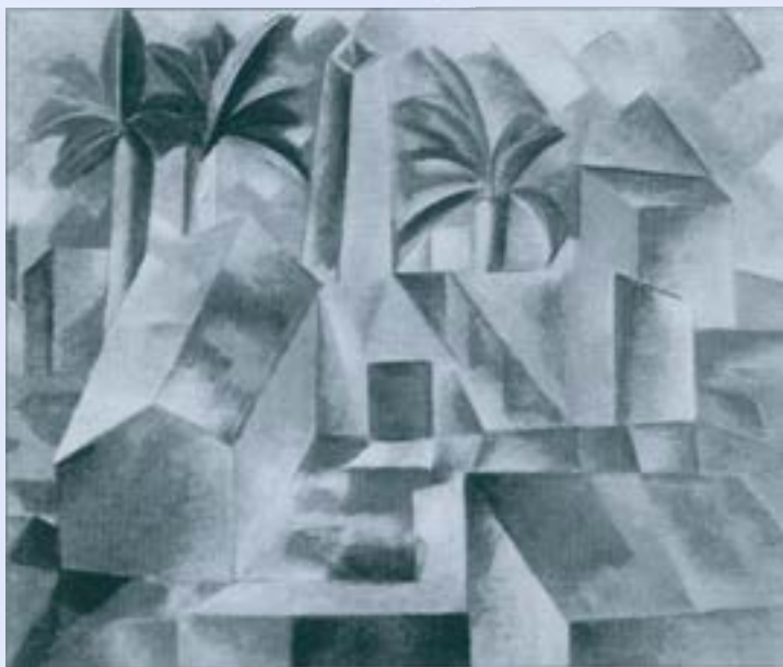
La fàbrica d'Horta. Horta, estiu del 1909.

Situant-nos al recorregut històric i cronològic de la representació de les obres exhibides, a banda dels dibuixos i notes de l'etapa d'aprenentatge, la conjuntura més interessant és la contemplació de les de l'etapa cubista, o les pintures i dibuixos de la seva segona estada, atès que pel fet d'estar ubicades en distints Museus d'Europa i Amèrica, i veure-les a través de reproduccions en llibres i històries d'art, és curiós, i important observar les obres en les seves mides originals, cosa que permet fer-se una idea de la seva envergadura artís-