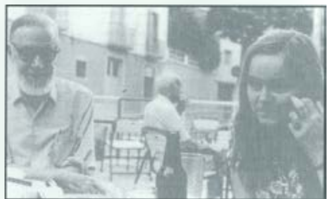
El poeta amb Judit, la seva traductora a l'anglès, en una terrassa de Centelles l'any 1974