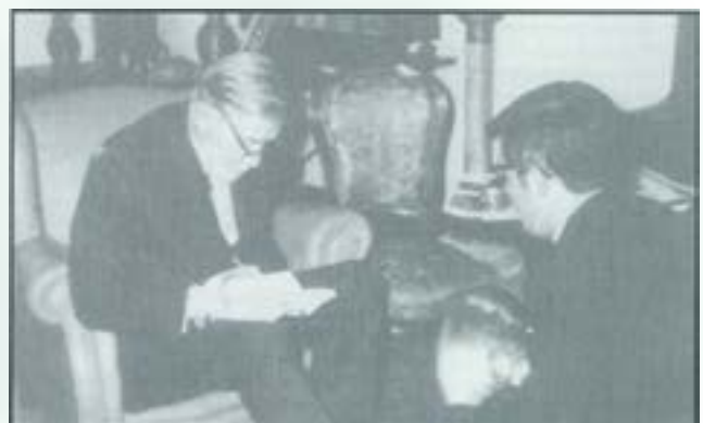
Pere Quart atenant una entrevista per a la premsa l'any 1965 a la casa de la Via Augusta de Barcelona