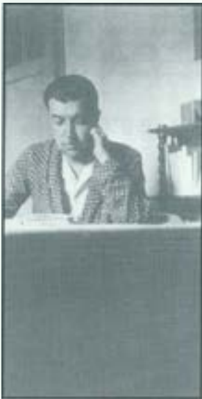
Foto de Pere Quart el dia que va fer 40 anys. És de l'any 1940 a Santiago de Xile