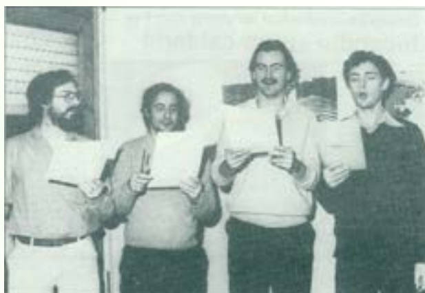
Festival d'estiu 1983 - Músics catalans, Barber Shop Classic Quarter. 14 de juliol, Amfiteatre Caixa de Sabadell.