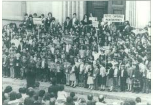
XII Trobada de Corals de Catalunya. Cantant a l'escalinata de Sant Fèlix, Sabadell 29 d'abril de 1979.

A més, l'entitat va participar activament del debat que va suscitar l'Ajuntament anunciant que el Conservatori Municipal de Música, ubicat a la Rambla, podria ocupar tres plantes de l'edifici de La Faràndula, una mesura que sortosament no va prosperar. Altres fites importants que es van dur a terme les darreries dels setanta van ser les audicions per a escolars, el Primer Concurs Comarcal Juvenil de Piano per a intèrprets de fins a 16 anys i, la més