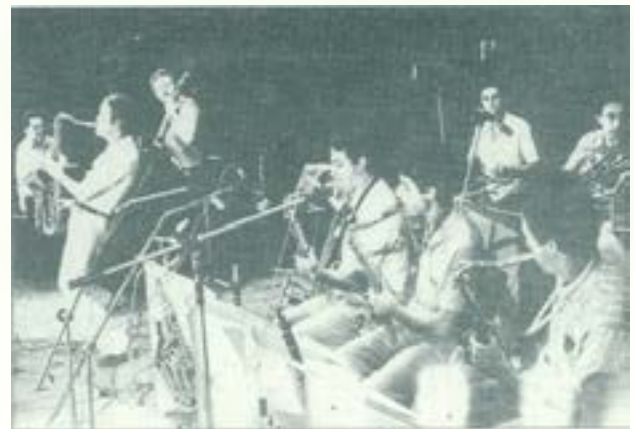
La Locomotora Negra, 15 de setembre de 1981. Quart Festival Internacional de Jazz a Sabadell, organitzat pel Club de Jazz de JJMM al Teatre Municipal La Faràndula.