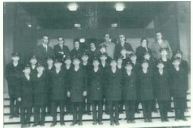
Els Petits Cantors de Viena al Teatre Euterpe, 12 de març de 1971.