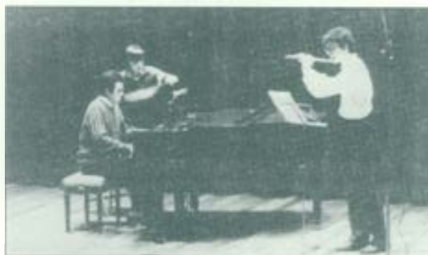
Audicions de joves intèrprets, gener 1986. Auditori de la Caixa de Sabadell.