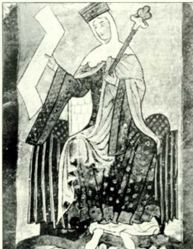
Urraca, filla d'Alfons VI de Castella i esposa en segones núpcies d'Alfons el Batallador; miniatura del Tumbo A., conservat a l'Arxiu de la catedral de Santiago.

R ealment la Història sols s'ha d'ocupar dels fets que es varen produir i, en molts casos, estudiar les causes que els originaren; quan la Història ha cercat d'establir lleis, generalment no ho ha aconseguit o bé solament ha arribat a formular hipòtesis, com en el cas de Toynbee!