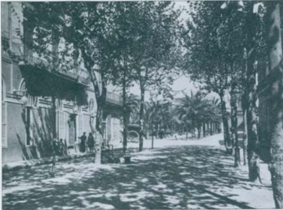
Vista del capdamunt de la Rambla, entorn l'any 1925, amb la Plaça del Dr. Robert al fons. (Museu d'Història de Sabadell).

elles el Centre Català, el Foment de la Sardana i l'Acadèmia Catòlica, i seran prohibits l'Aplec de Togores, el romiatge a Montserrat i la Diada a Guimerà, tots ells perquè duïen a terme unes activitats de foment de la identitat i de la llengua catalanes.