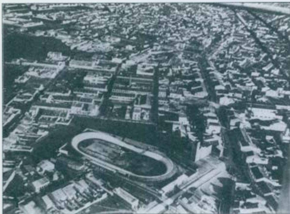
Vista aèria de Sabadell del 1919, amb el velòdrom i l'església de la Creu Alta en primer terme. (Museu d'Història de Sabadell).

de Sabadell comptarà amb una nova via ferroviària. Al primitiu traçat, el tren del Nord, que encerclava gairebé tota la ciutat i que comptava amb dues estacions, li sortirà la "competència", tot i que amb unes característiques diferents. La nova línia està pensada per a trens de via estreta moguts per l'electricitat, que partint de Barcelona arribin al Vallès Occidental passant per localitats com ara Valldoreix, La Floresta, Sant Cugat i Bellaterra, potenciant d'aquesta manera la idea de "ciutats-jardí" com a llocs de residència. L'any 1919 el tren arribarà a Terrassa, i a Sabadell no ho farà fins l'any 1922, entrant per ponent fins a la carretera de Rubí. Tres anys més tard es disposarà d'una nova estació al bell mig de la ciutat, després d'una forta polèmica pel traçat -a l'aire lliure o ensorrat- que havia de seguir.