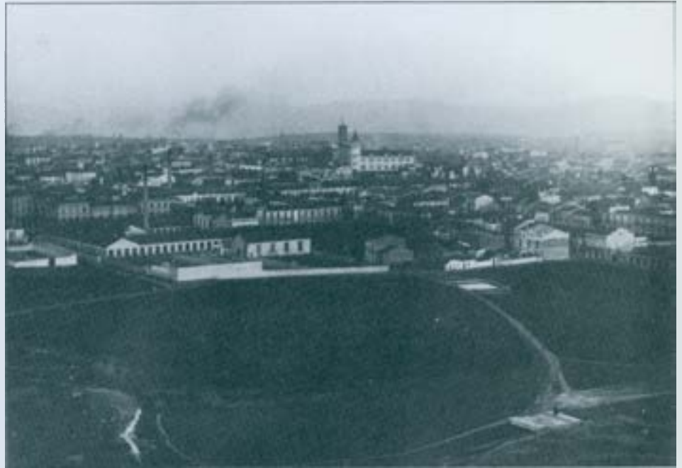
Vista de Sabadell del 1911, des del cim de la xemeneia de Can Carol.

A inicis del segle XX Sabadell compta amb uns 23.000 habitants, tenint per da-