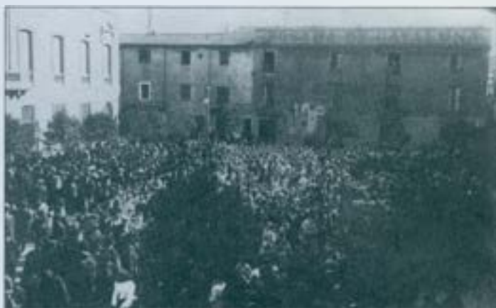
Primera Festa de l'Arbre, l'any 1905, Plaça de Sant Roc.

actes culturals i de lleure. L'escenari natural del bosc de Can Feu permetia multitud d'activitats, des de llargues passejades, berenars i trobades esportives, a actes com aplecs de sardanes, concerts i representacions teatrals, algunes tan rellevants com la representació de "Terra Baixa" l'any 1915 o la representació de l'òpera "Carmen" per la Companyia del Liceu el 1917, que trascendiren més enllà de la ciutat.