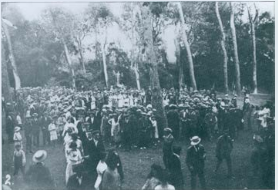
Festa Major de 1913. Bosc de Can Feu.

També els espais a l'aire lliure seran lloc preferent pels sabadellencs en els seus