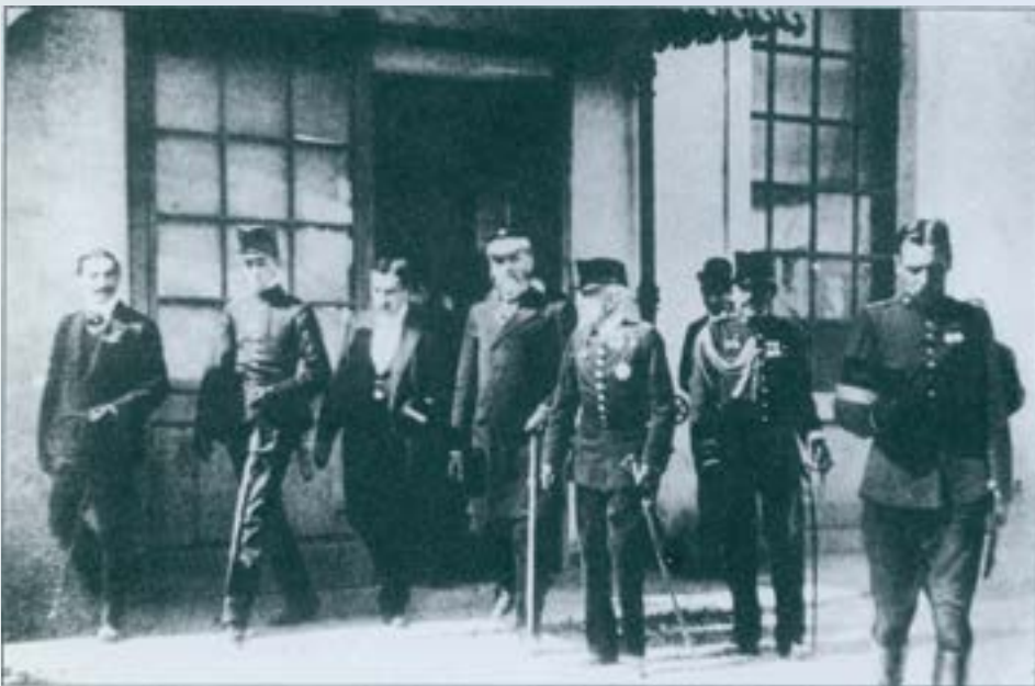
Visita de S.M. Alfonso XIII, el 18 d'abril de 1904, a la fàbrica Grau, S.A. acompanyat del Ministre de la Guerra i del Governador Civil. (Arxiu Històric de Sabadell).

En un segon terme apareixen els homes de la Unió Republicana que polemitzaran amb els federals a l'hora de presentar-se com a representants de les classes populars, si bé en les confrontacions electorals dels primers anys del segle es presentaran conjuntament, assolint la victòria i iniciant una majoria d'esquerres a l'Ajuntament, que durarà fins el 1909.