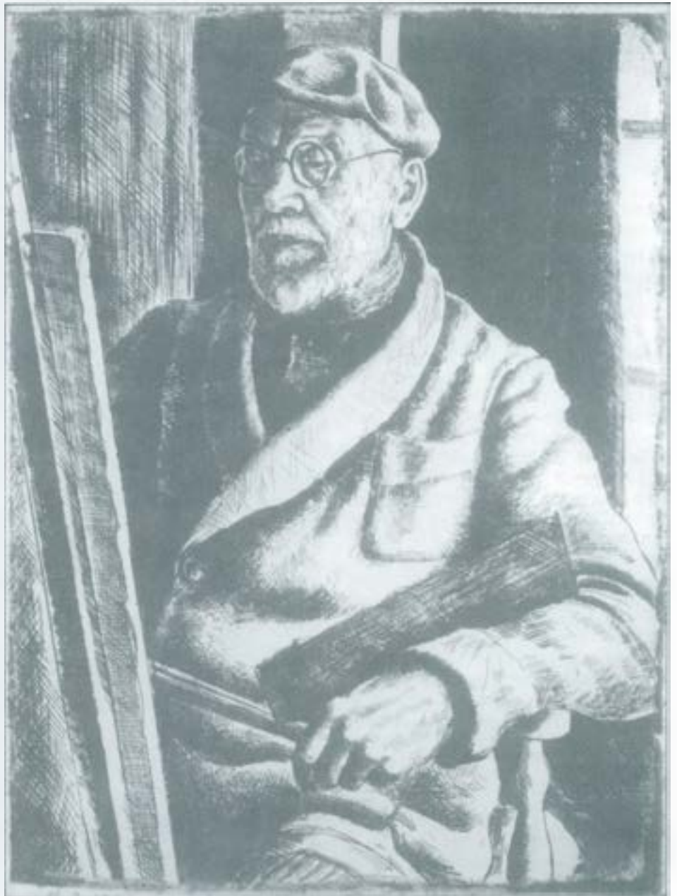
El pintor Vila Cinca. Aiguafort (1936).

El sentiment de força, rotunditat i expressió han estat conferits tant per la línia pura com per la taca corpòria i turgent. Com que el seu llenguatge és marcadament pictòric -faci el que faci, Vila Arrufat mai no deixa de ser un pintor-, dibuixar amb el llapis o el pinzell litogràfic li pot oferir grans possibilitats, però un dels seus aiguaforts pot posseir